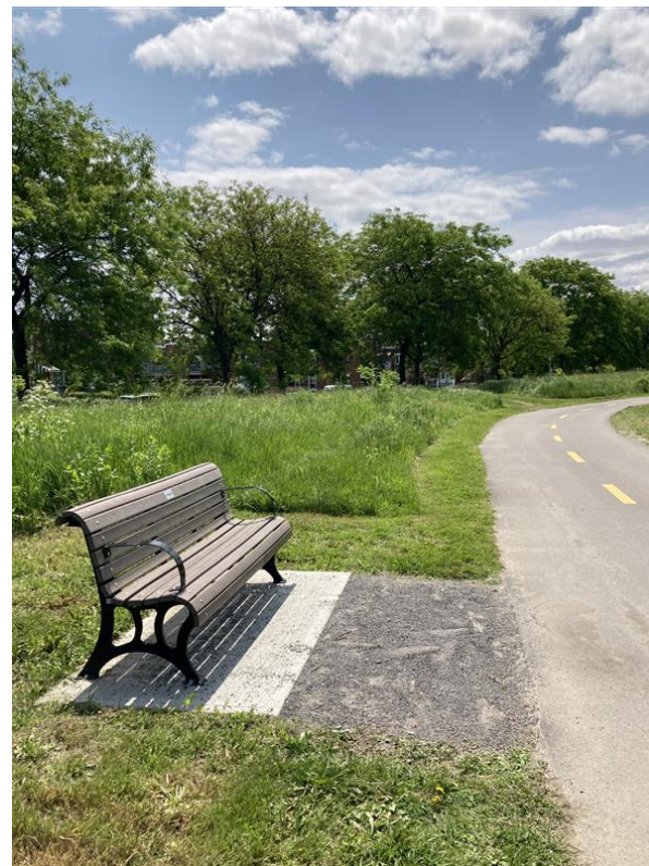
Intégration de mobilier urbain