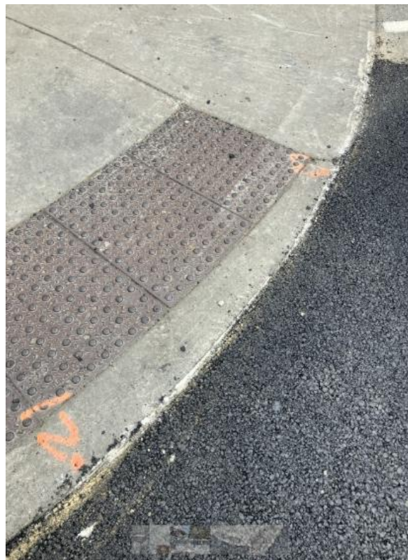
Normalisation des bordures de trottoirs