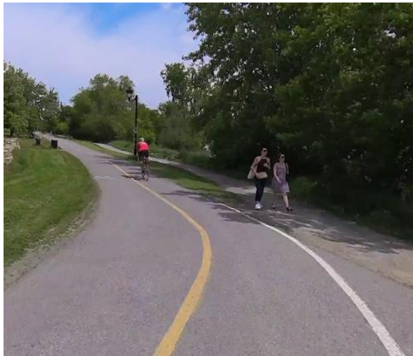
Séparation des usages