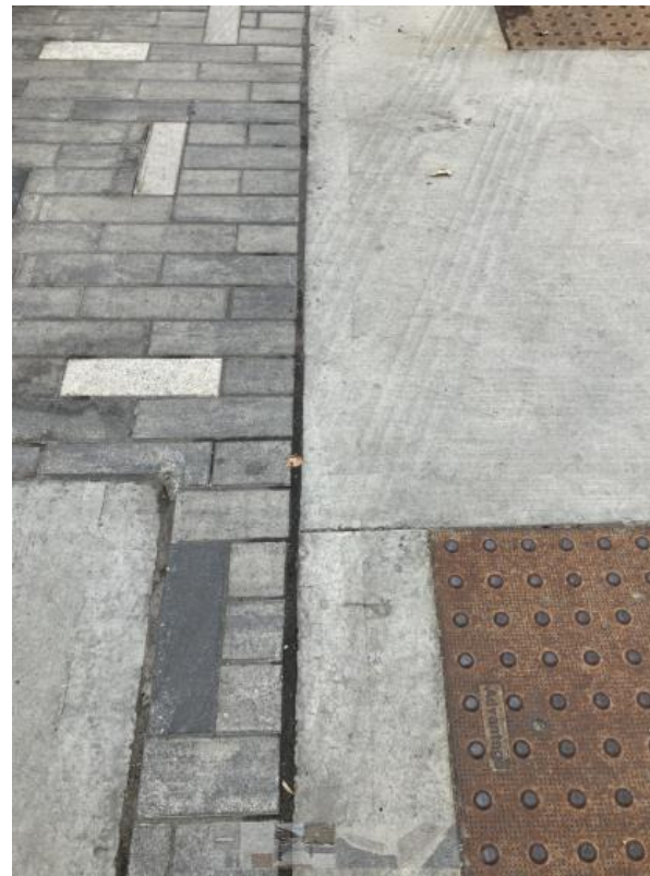
Surfaces texturées et contrastantes