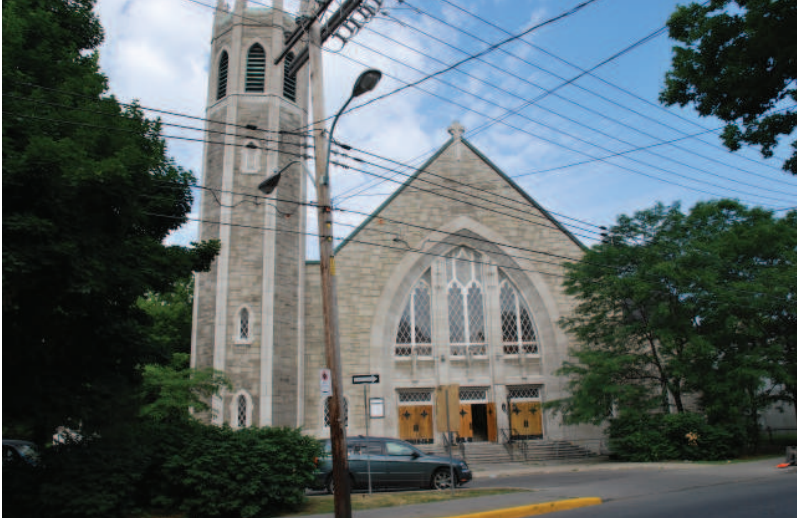
Église Notre-Dame-de-la-Paix