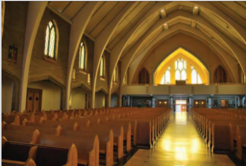
La nef, vue vers le jubé arrière