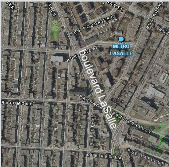
Le secteur de l'église Notre-Dame-de-la-Paix

La valeur urbaine du site de l'église Notre-Dame-de-la-Paix repose sur :