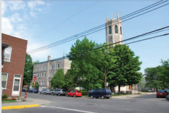
Le site depuis la rue Ethel