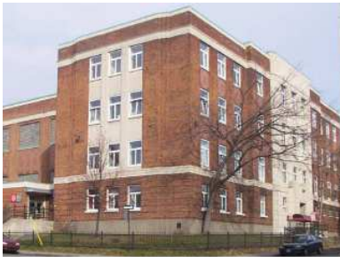
Centre communautaire Notre-Dame-de-Grâce