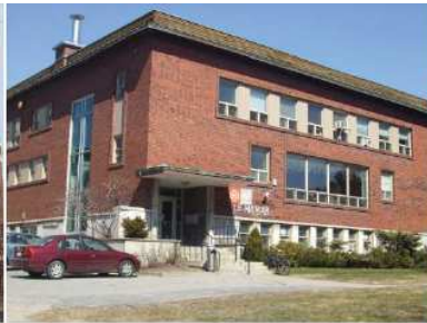
Centre Le Manoir