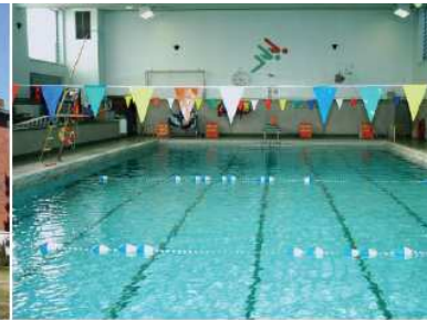
Piscine intérieure Notre-Dame-de-Grâce