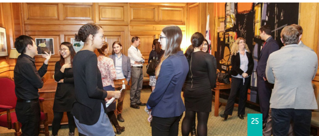
Soirée de retrouvailles avec les ancien.nes membres à l'hôtel de ville de Montréal