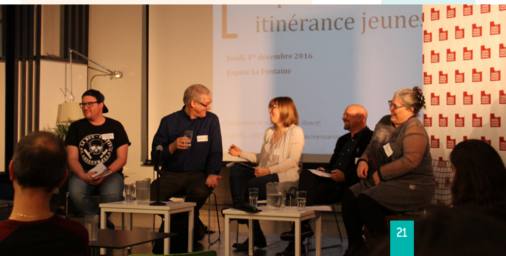
Panel d'experts sur les approches préventives en itinérance jeunesse à l'Espace La Fontaine, le 1 er décembre 2016

Au printemps 2017, dans le cadre des festivités du 375 e de Montréal, l'organisation d'un Sommet de la jeunesse sera le point culminant de cette vaste recension des idées des jeunes Montréalais.es pour l'avenir de leur ville.