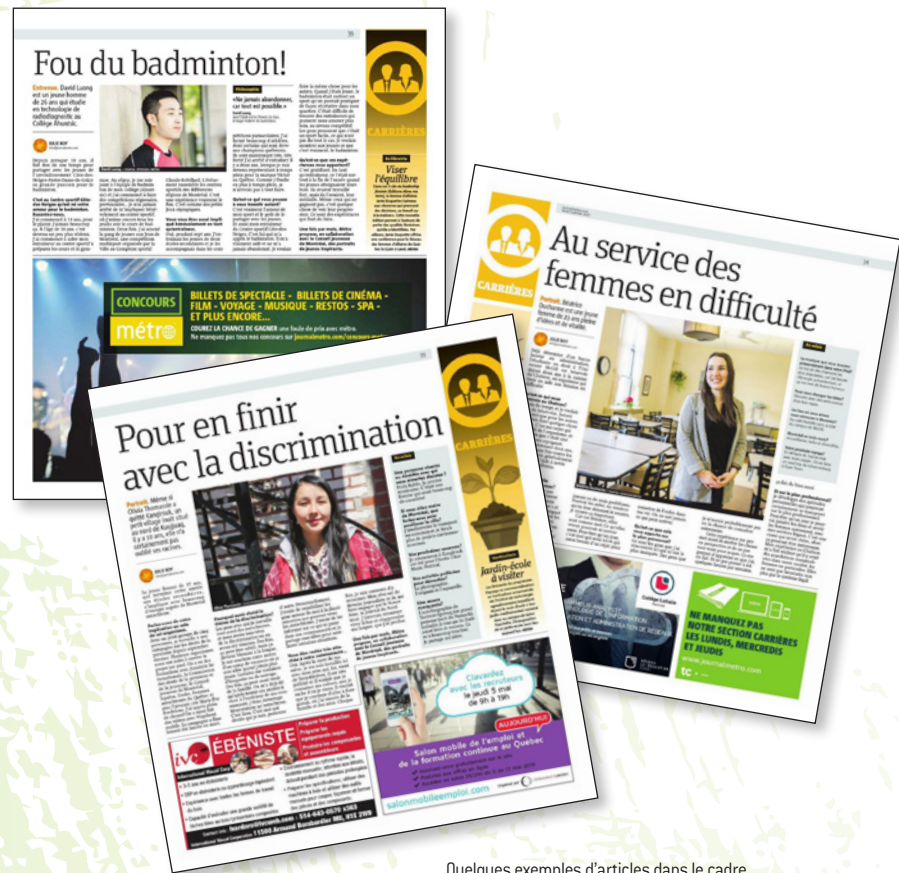
Quelques exemples d'articles dans le cadre de notre collaboration avec le journal Métro