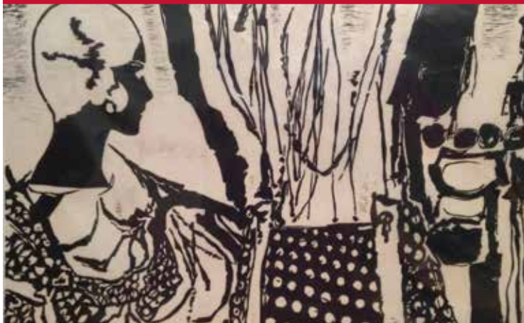
Albert Dumouchel, Le profil d'Anna , Bois gravé, 1969