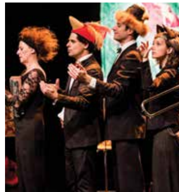
Pierre et le loup

Nouveauté ! Le programme Hors les murs vous propose trois spectacles pour la famille à la Maison d'Haïti : le samedi 25 février à 15 h, Le Cygne du Théâtre de Deux Mains (2 à 5 ans), le samedi 11 mars à 15 h, Les bois dormants (dès 4 ans) et le samedi 25 mars à 15 h, Pierre et le loup par Les Jeunesses musicales du Canada (4 à 8 ans). Entrée libre.