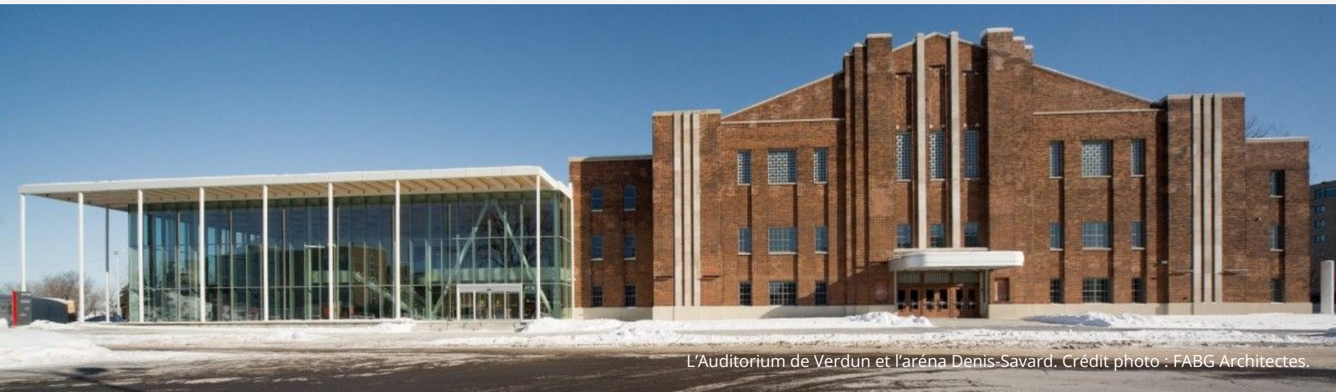
L'Auditorium de Verdun et l'aréna Denis-Savard. Crédit photo : FABG Architectes.