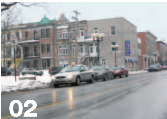
Notre-Dame Ouest / Square Sir-Georges-Étienne-Cartier > angle sud-ouest

Aucun taxi ne sera toléré devant le 900, boulevard René-Lévesque. L'offre de service se fait sur Mansfield.