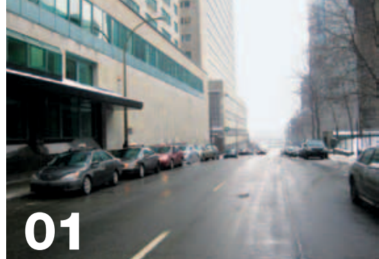
Mansfield / René Lévesque > angle sud-est

Il y aura une présence accrue des inspecteurs et des policiers afin d'assurer un bon fonctionnement du service au poste d'attente.