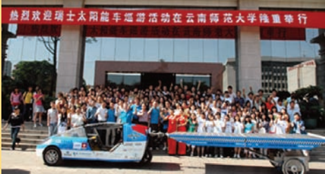
Mi-avril 2008, Louis Palmer fait un passage remarqué en Chine.

L'environnement est devenu un sujet incontournable et la conscience de plusieurs est en alerte quant à la détérioration des conditions de vie. La nécessité étant la mère de l'invention, pas surprenant de voir des gens prendre le taureau par les cornes pour tenter d'apporter leur contribution afin d'améliorer les choses. Une équipe suisse allemande menée par le scientifique Louis Palmer a mis au point un véhicule pouvant rouler 100 kilomètres par jour grâce à des panneaux solaires d'une surface de six mètres carrés. La société allemande Q Cells a conçu les panneaux. L'objectif de M. Palmer : faire le tour du monde.