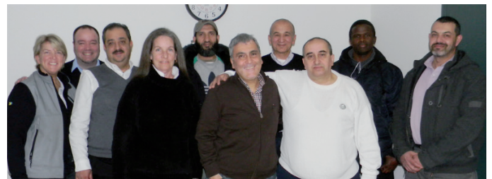
Photos: (Haut) Chauffeurs Taxi Diamond, (Bas) Chauffeurs Van médic.

L'AMÉLIORATION DE L'EXPÉRIENCE CLIENT PASSE PAR UN SERVICE : - SÉCURITAIRE - FIABLE ET PONCTUEL - COURTOIS