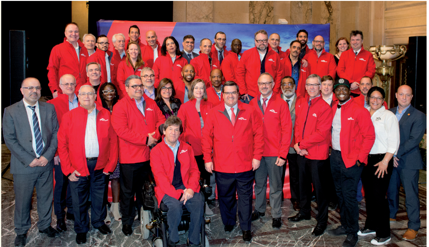
Le maire Denis Coderre était présent au lancement, en compagnie d'élus, de représentants et de partenaires de l'industrie et du BTM. Les taxis Bonjour se distinguent au sein de l'offre de transport et attirent l'attention de la clientèle.