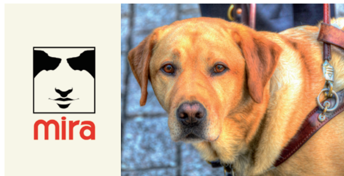
Logo de la Fondation MIRA, qui fournit des chiens aux handicapés visuels.

Un client qui s'est vu interdire l'accès à un taxi à cause de son chien-guide ou d'assistance peut aussi porter plainte à la Commission des droits de la personne et des droits de la jeunesse ou intenter un recours civil.