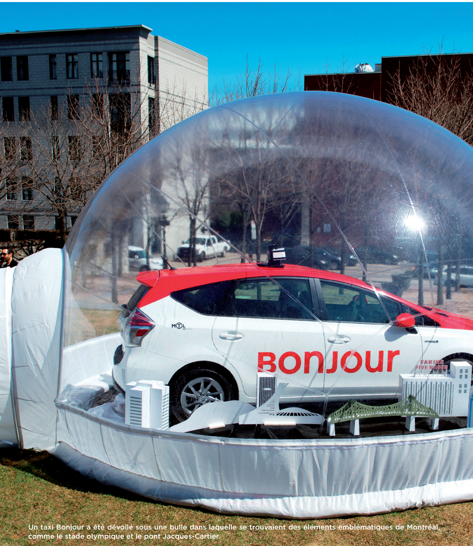
Un taxi Bonjour a été dévoilé sous une bulle dans laquelle se trouvaient des éléments emblématiques de Montréal, comme le stade olympique et le pont Jacques-Cartier.