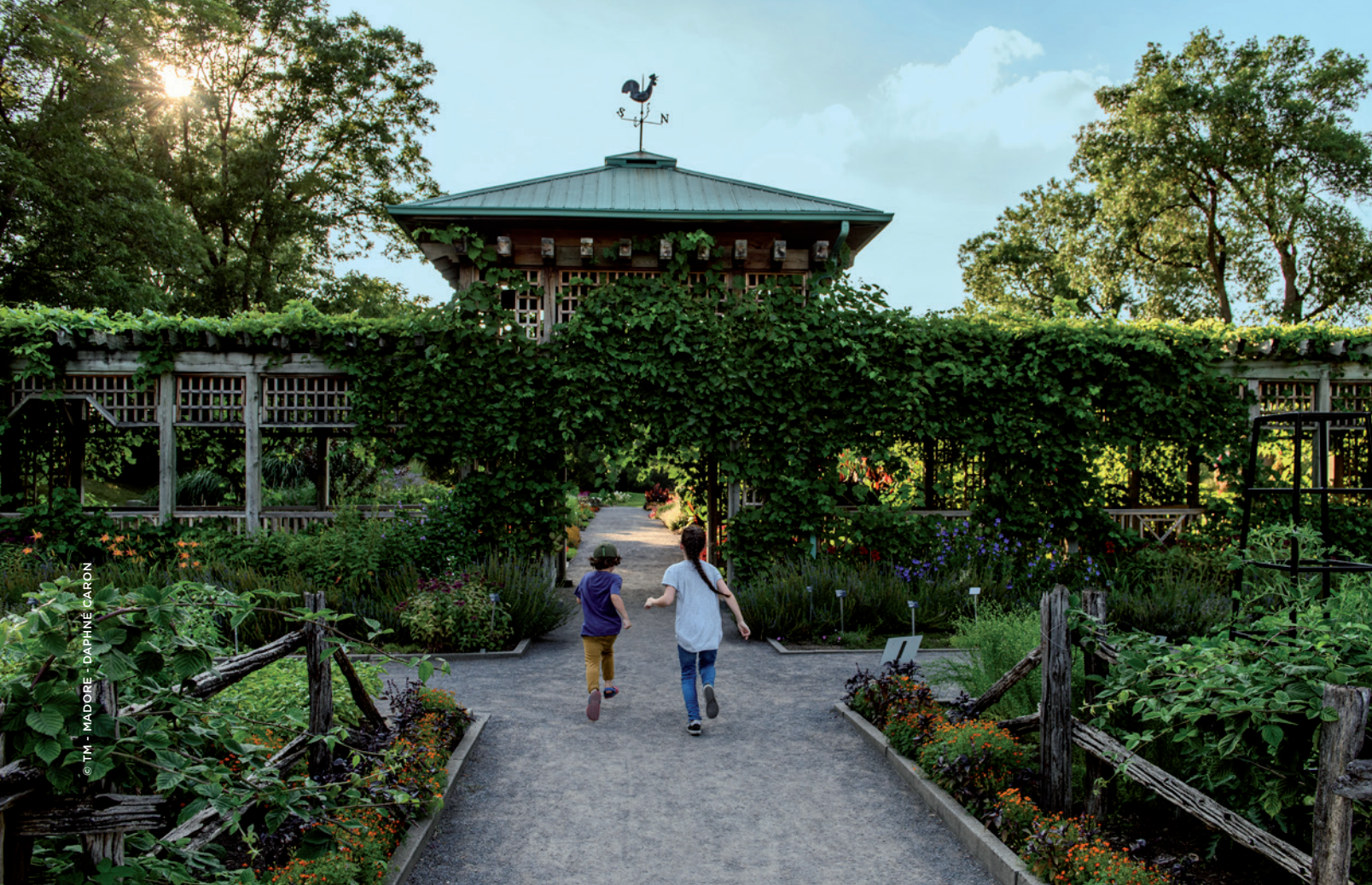
© TM - MADORE - DAPHNE CARON