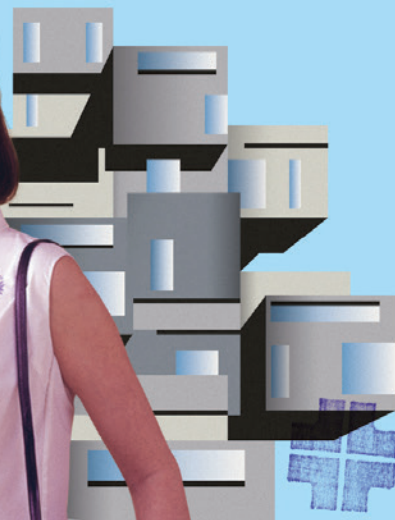
PAVILLON DU QUÉBEC