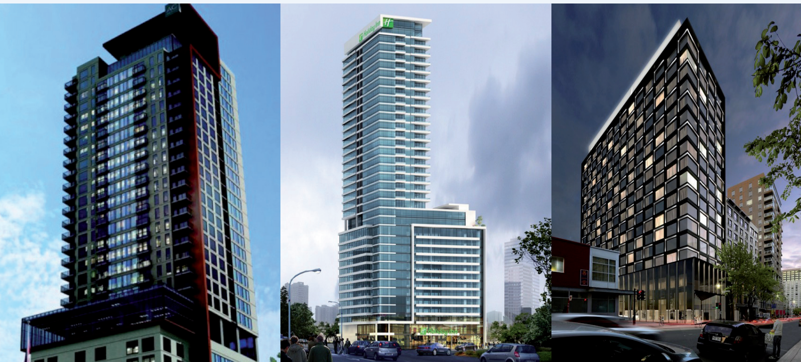
Page de gauche: Le Mount Stephen. En haut: 1- A.C. Marriott, 2- Holiday Inn & Suites Montréal, 3- Hôtel Monville. En bas: Fairmont Le Reine Elizabeth.

Sur le boul. René-Lévesque Ouest, entre le boul. Robert-Bourassa et la rue Mansfield. RÉ-OUVERTURE: JUILLET 2017.