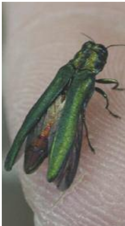
L'adulte de l'agrile du frêne est un coléoptère vert métallique dont la taille varie entre 8,5 et 14 mm.