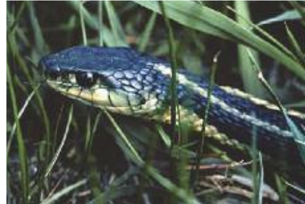
Couleuvre rayée (qc.ec.gc.ca/faune)

Lorsqu'elle est menacée, la couleuvre rayée préfère s'enfuir. Elle peut aussi excréter un liquide nauséabond pour faire fuir ses prédateurs. Elle peut mordre si on l'attrape mais ne peut pas blesser sérieusement.