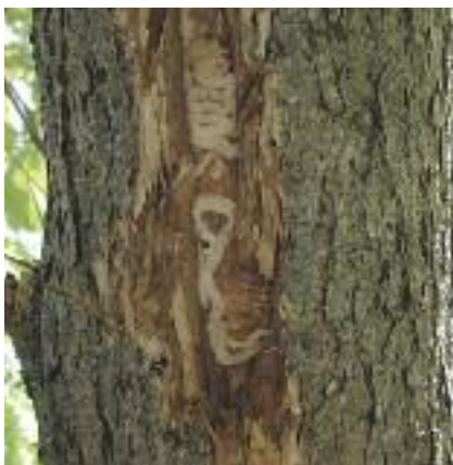
Présence, sous l'écorce, de galeries sinueuses résultant de l'alimentation des larves d'agrile.