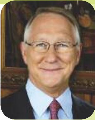
Gérald Tremblay Maire de Montréal