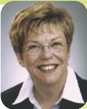
Monique Worth Maire d'arrondissement