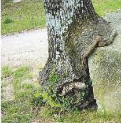
L'arbre mangeur de rocher par Alain Maraval (l'internaute.com) Un arbre ne peut exercer de pression sur les objets. Il les contourne.

On blâme souvent les racines d'arbres de bloquer des tuyaux, de soulever des trottoirs ou de percer des fondations. Bien que ces phénomènes soient observables, il importe de démystifier les causes de tous ces problèmes en rétablissant quelques faits.