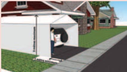
Illustration : Éric Massie

Distance minimale entre l'abri et le trottoir : 1 m