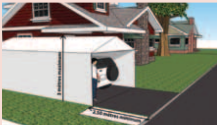
Illustration : Éric Massie

Distance minimale entre l'abri et la bordure de la rue : 2,5 m