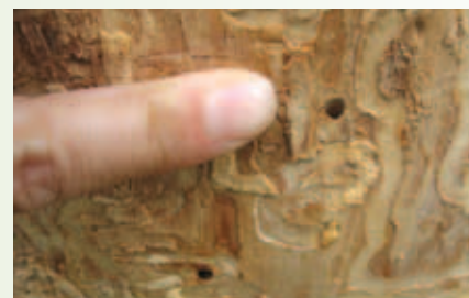
Dommages causés par les larves d'agrile du frêne et trous de sortie en forme de D.

Pour plus de renseignements sur l'agrile du frêne, visitez le site Internet de la Ville de Montréal : ville.montreal.qc.ca/agrile .