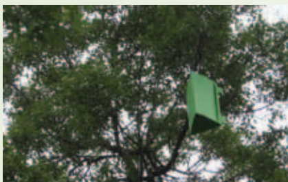
Piège pour détecter la présence de l'agrile du frêne.

Parmi ces actions, l'arrondissement de Pierrefonds-Roxboro a installé six (6) pièges pour capturer les insectes adultes. Ces pièges ont été installés dans des frênes publics à des endroits stratégiques afin de bien couvrir le territoire d'est en ouest. Les pièges ont été retirés pour examen à la fin d'août. Aucun des pièges ne contenait de spécimen d'agrile du frêne. Cela dit, ça ne nous permet pas de conclure qu'il n'y en a pas sur le territoire. Nous restons donc aux aguets en procédant à l'inspection visuelle plus avancée des frênes suspects et au dépistage par écorçage de frênes publics.