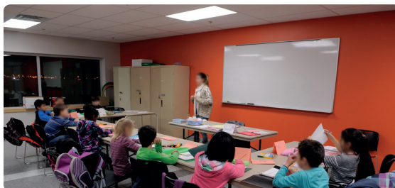
Les enfants écoutent l'animatrice lors d'un atelier d'anglais par le jeu offert par l'arrondissement.