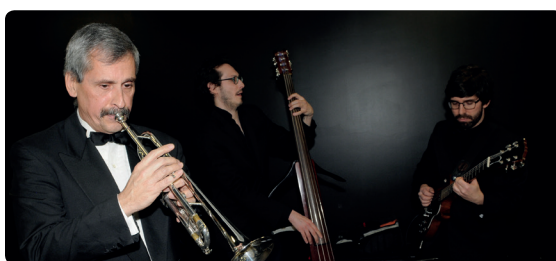
L'arrondissement remercie l'Éveil musical Anjou d'avoir créé gracieusement une très belle ambiance musicale pendant l'événement.