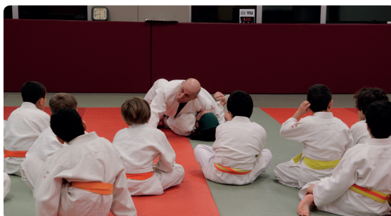
Le professeur de judo démontre une immobilisation à de jeunes judokas dans la nouvelle salle de combat.