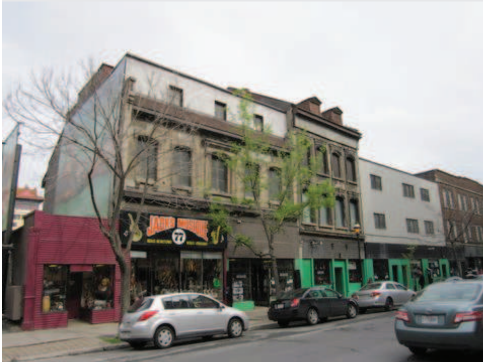
Façades des bâtiments - Rue Saint-Antoine