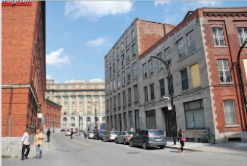
Vue de la rue Wellington vers la rue McGill (Ville de Montréal, septembre 2012)