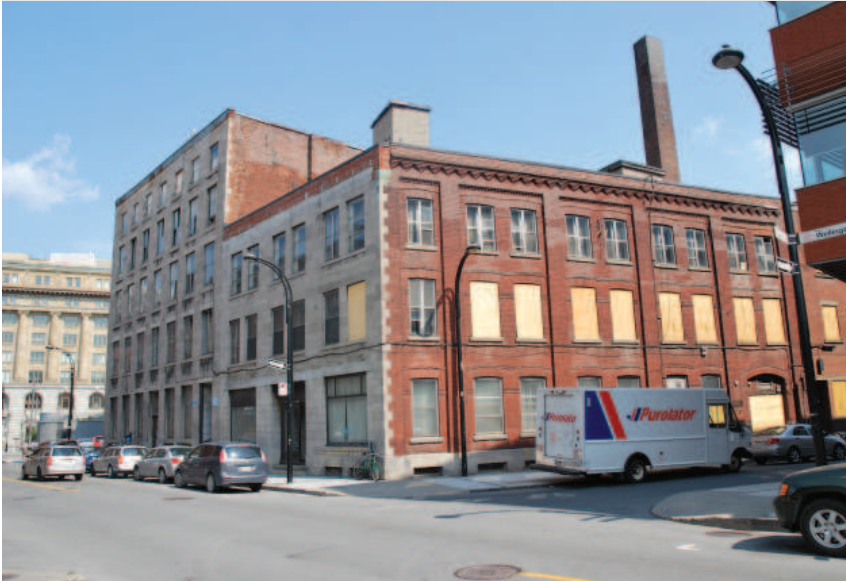
648-650, rue Wellington et 91, rue King