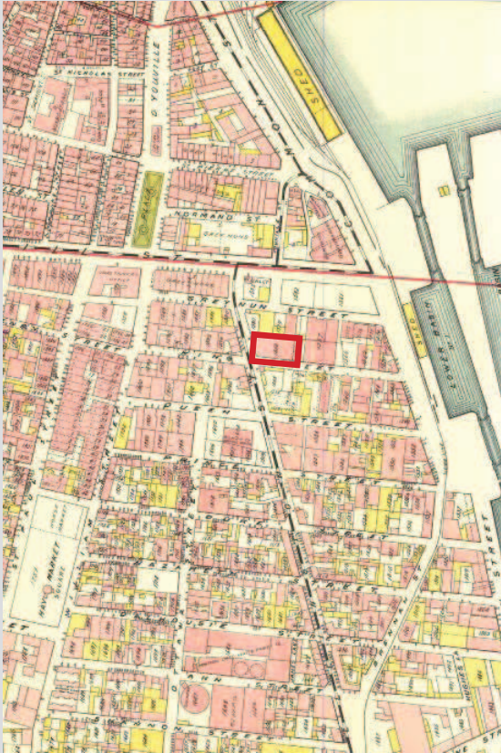
Le secteur en 1907

La valeur historique du site des bâtiments situés aux 648-650, rue Wellington et 91, rue King repose sur :