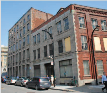
Les bâtiments situés aux 648 et 650, rue Wellington