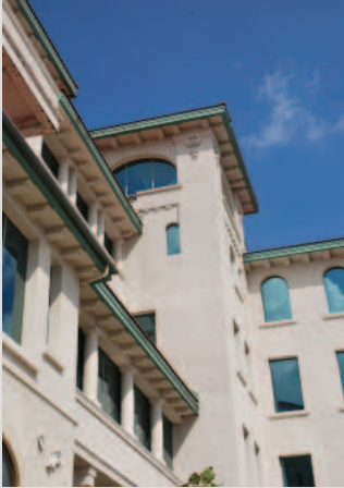
Détails architecturaux et articulation de volumes de la façade principale

La valeur architecturale du 5935, chemin de la Côte-de-Liesse repose sur :