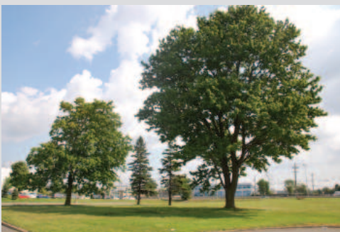
Les pelouses et les arbres du site

La valeur urbaine du 5935, chemin de la Côte-de-Liesse repose sur :