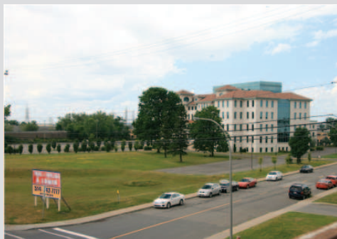
Le bâtiment depuis le chemin de la Côte-de-Liesse