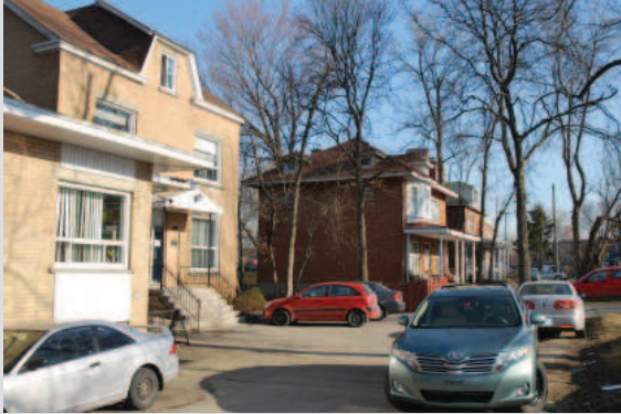
Le 2901 et les trois maisons voisines à l'est

La valeur paysagère et urbaine du site du 2901 Gouin Est repose sur :