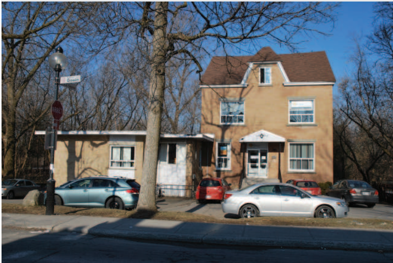
Le 2901 Gouin Est