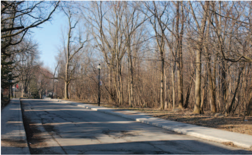
Le boulevard Gouin Est longeant une partie du parc-nature de l'île de la Visitation, tout juste à l'ouest de la propriété à l'étude.