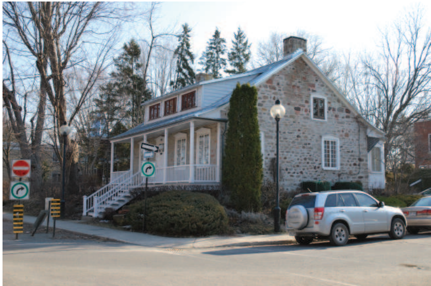
La maison Louis-Dagenais, une ancienne maison de ferme construite entre 1767 et 1807 et située face à la propriété à l'étude.