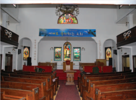
Décor intérieur de l'église

La valeur architecturale de l'église Central Korean United repose sur : - la sobriété de son architecture extérieure qui emprunte davantage au vocabulaire de l'architecture scolaire avec l'ajout d'un modeste clocher et d'une abside aplatie; - l'élégance modeste des intérieurs avec son mobilier et ses vitraux.