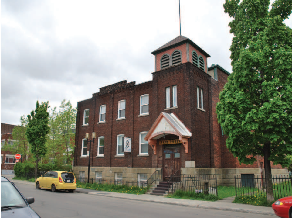
Façade du bâtiment - Rue Hadley

Désignation patrimoniale fédérale : Aucune