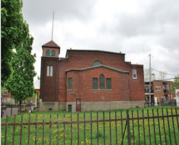
Façade latérale vue de la rue De Biencourt

La valeur historique de l'église Central Korean United repose sur son témoignage : - de la présence dans le quartier de Côte-Saint-Paul de l'église St.Paul Methodist (fondée en 1856), de l'église unie Saint-Paul et de l'église Central Korean United; - de la philosophie méthodiste d'origine, basée sur la sobriété et l'enseignement aux différentes générations de la communauté; - de l'appropriation des lieux par les communautés qui l'ont occupé et adapté selon leurs besoins au culte de l'église unie, d'abord canadien-anglais, puis coréen.