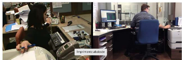
Tout est maintenant à portée de main.