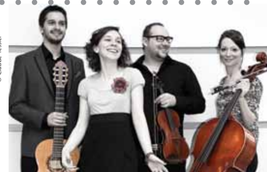
Ensemble La Virevolte

Samedi 29 mars à 15 h Auditorium Le Prévost TOUT CE QUE VOUS N'AVEZ JAMAIS VU À LA TÉLÉ Abat-Jour Théâtre, en coproduction avec L'Arrière Scène (pour les 9 ans et plus)