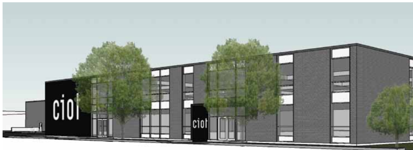
Ciot investira 3 M$ pour agrandir un bâtiment situé dans le secteur industriel Crémazie – de l’Esplanade afin d’y installer son centre de distribution.

Villeray–Saint-Michel–Parc-Extension est le premier arrondissement de la Ville de Montréal à mettre en place ce type de modification sur ce genre d’appareil.