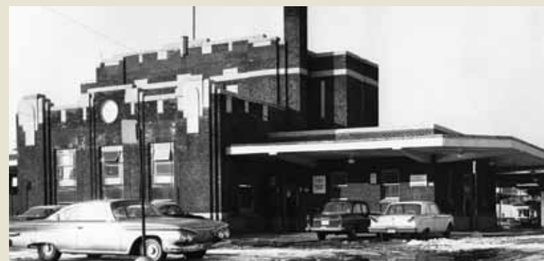
Bibliothèque Shamrock vers 1964

La bibliothèque Le Prévost est établie dans le quartier de Villeray depuis 30 ans. Mais saviez-vous qu'elle était autrefois connue sous le nom de bibliothèque Shamrock ?