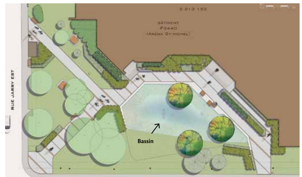
Le bassin de rétention d'eau sera intégré à un nouvel espace vert.

Le Fonds municipal vert MC de la Fédération canadienne des municipalités appuie les partenariats et sert de levier aux projets financés par les secteurs public et privé afin d'atteindre des normes supérieures de qualité de l'air, de l'eau, du sol et de protection du climat.