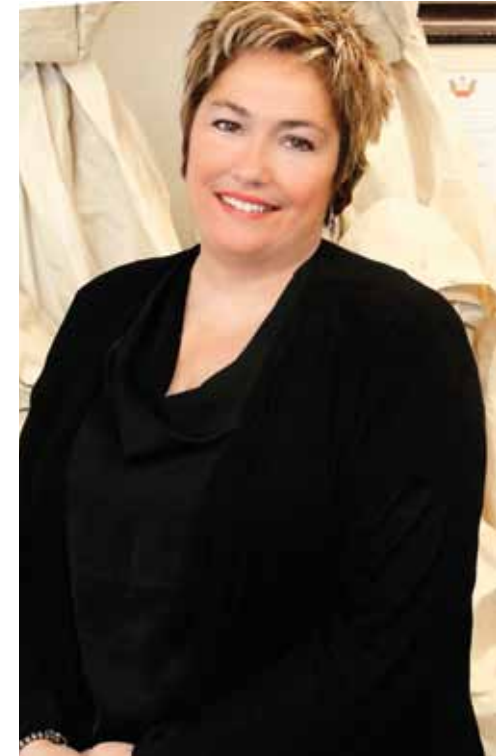
Votre maire d'arrondissement,

Je joins ma voix à celle de mes collègues pour vous souhaiter un Joyeux Noël et une bonne année 2014!