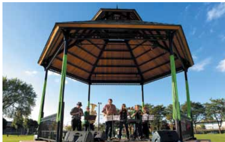
La Fanfare Jarry lors de l'inauguration du kiosque du Parc Howard, le 25 septembre dernier.