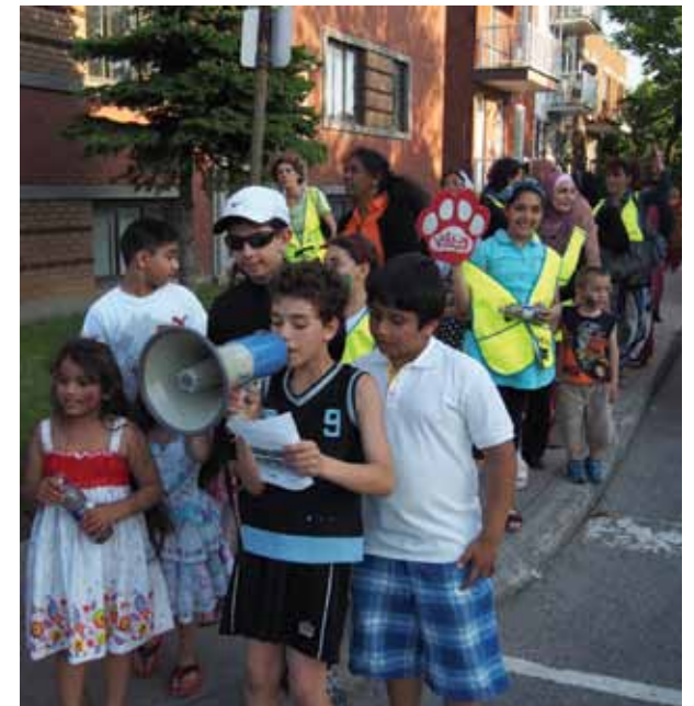
Le projet Quartier 21 Parc-Extension : la rencontre en transport actif! a dressé un bilan positif de sa deuxième année d'activités. Plusieurs initiatives réussies, dont le Trotibus, se poursuivront au cours de la troisième et dernière année du projet.

flickr Consultez nos albums photos sur Flickr! flickr.com/people/mtl_vsp