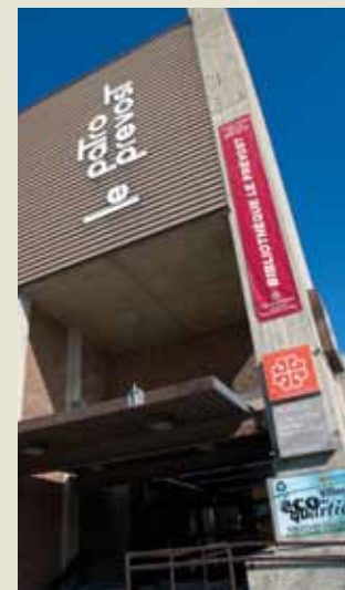
Bibliothèque Le Prévost

Une autre page d'histoire sera écrite prochainement puisque la bibliothèque déménagera d'ici quelques années dans un nouvel immeuble (voir l'article en page 1) et changera à nouveau de nom pour porter celui du quartier : bibliothèque de Villeray.