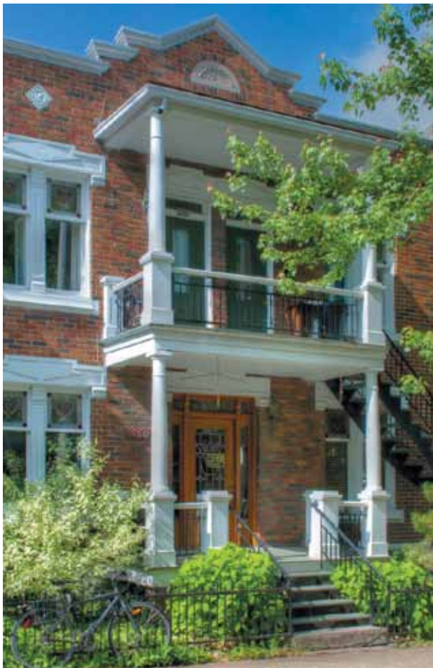
Les propriétaires d'un triplex construit dans les années 1930, situé au 8250-8254, avenue Henri-Julien, dans le quartier de Villeray, ont remporté le Prix émérite du patrimoine | Catégorie résidentielle dans le cadre de l'Opération patrimoine architectural qui s'est déroulée en septembre. Félicitations!