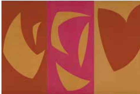
TRIPTYQUE OCRE VIOLET ROUGE, 1965, Huile sur toile, 195,4 x 291,6 cm, COLLECTION DU MUSÉE NATIONAL DES BEAUX ARTS DU QUÉBEC © Succession Fernand Leduc / SODRAC (2016)

Les cimaises du marché Atwater accueilleront des reproductions de tableaux de Fernand Leduc. Cette présentation d'œuvres ponctuent les moments charnières du peintre de l'ombre et de la lumière, signataire du Refus global. Un itinéraire sensible et déterminant dans l'histoire de la peinture canadienne. Ces œuvres font partie de la collection du Musée national des beaux-arts du Québec.