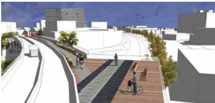
Vision d'avenir du viaduc

Un belvédère est aménagé sur le tablier du viaduc, donnant ainsi une vue imprenable sur la ville.