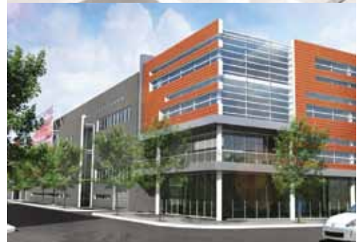
Centre de transport de la STM