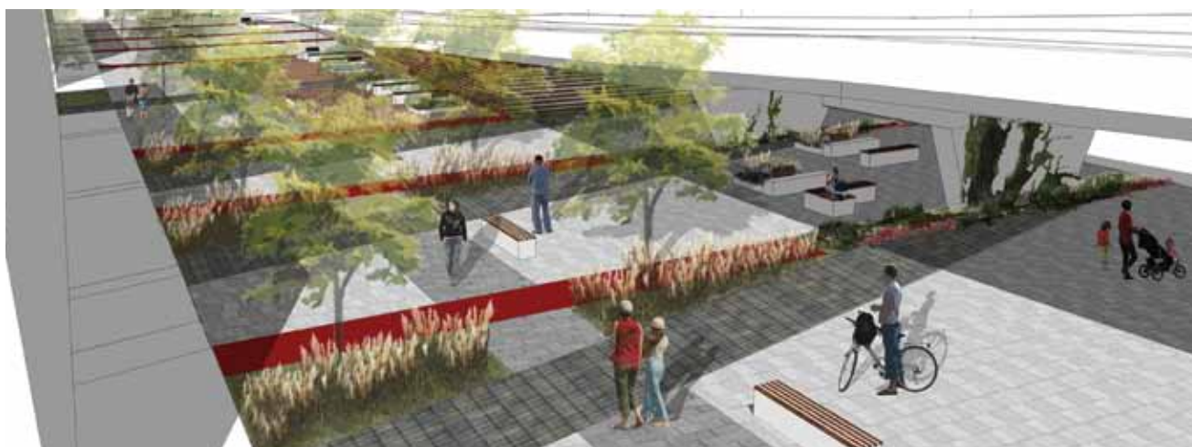
Promenade urbaine en bordure du viaduc