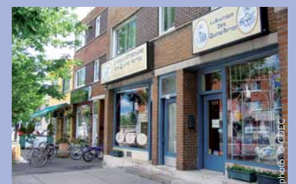
Le P'tit Beaubien sera encore plus accueillant cet été.

Ce projet a été rendu possible grâce au soutien de l'arrondissement, avec la collaboration de la Société de développement environnemental de Rosemont (SODER) et de la Corporation de développement économique communautaire (CDEC) Rosemont-Petite-Patrie.