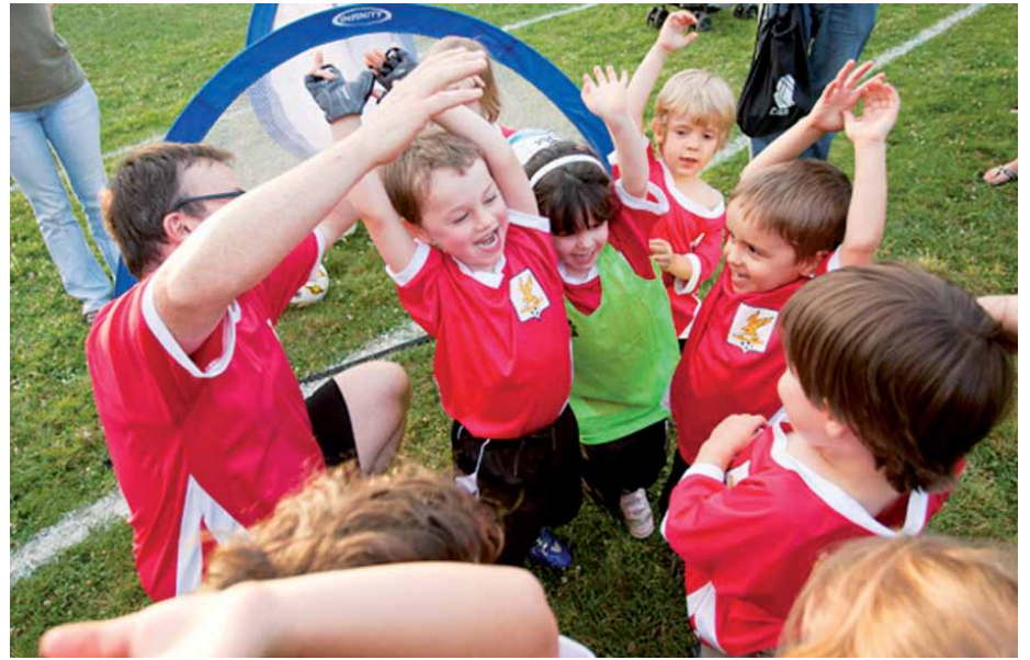
Le plaisir de jouer : la clé du succès de l'Association de soccer de Rosemont–La Petite-Patrie.

Fort du succès des miniterrains installés pour les 4 à 6 ans au parc de la Cité-Jardin en 2011, l'arrondissement poursuit l'implantation de cinq nouveaux miniterrains pour les 7 à 8 ans au parc Saint-Émile, pour la saison 2012.