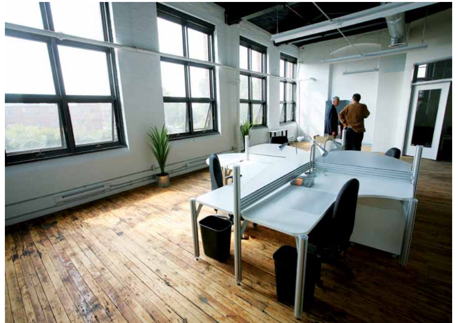
Le CTS vient en aide au développement d'entreprises en technologies de la santé et à la création d'emplois de qualité.

Le CTS est né d'une initiative de la Corporation de développement économique communautaire (CDEC) Rosemont-Petite-Patrie, en collaboration avec la Ville de Montréal, le ministère des Affaires municipales, des Régions et de l'Occupation du territoire, la Fédération des caisses Desjardins du Québec, la Conférence régionale des élus de Montréal et l'arrondissement de Rosemont-La Petite-Patrie.