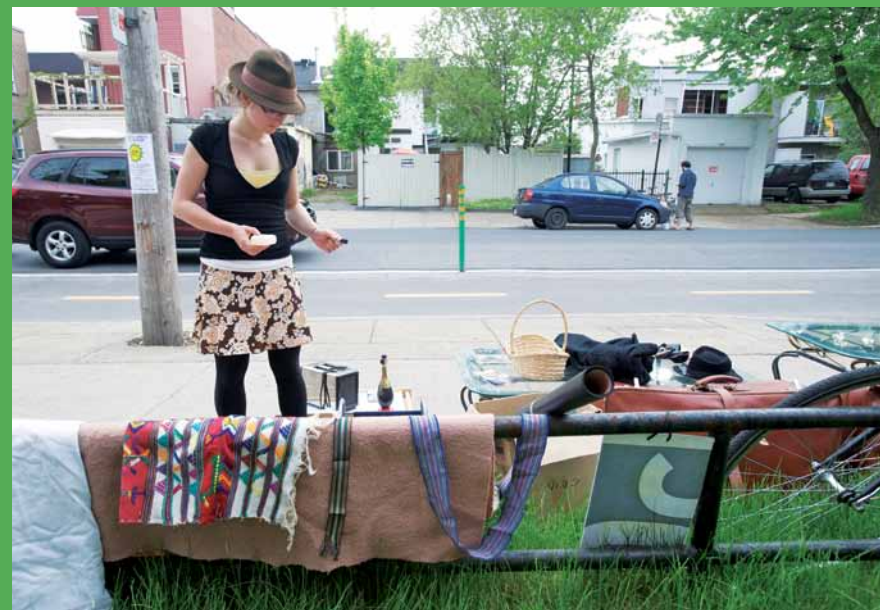
Les ventes-débarras à dates fixes, un bon moyen de donner une seconde vie aux objets que vous n'utilisez plus.

L'affichage doit se faire sur la propriété où se déroule la vente quatre jours avant sa tenue et devra être enlevé au plus tard une heure après.