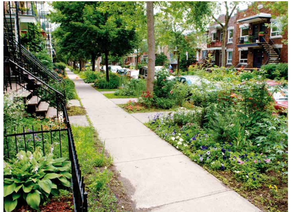
La participation des citoyens, de l'amour, un peu d'eau: et voilà le travail!

Dans la prochaine chronique: la préparation hivernale des végétaux et les précautions à prendre pour diminuer les dommages possibles associés au déneigement.