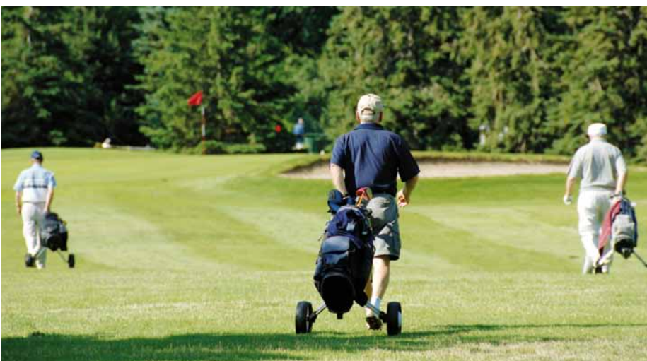
Le Golf municipal de Montréal, un joyau de l'arrondissement.

Ouvert tous les jours à partir de 8 h 30 (sauf les mardis, à partir de 10 h)