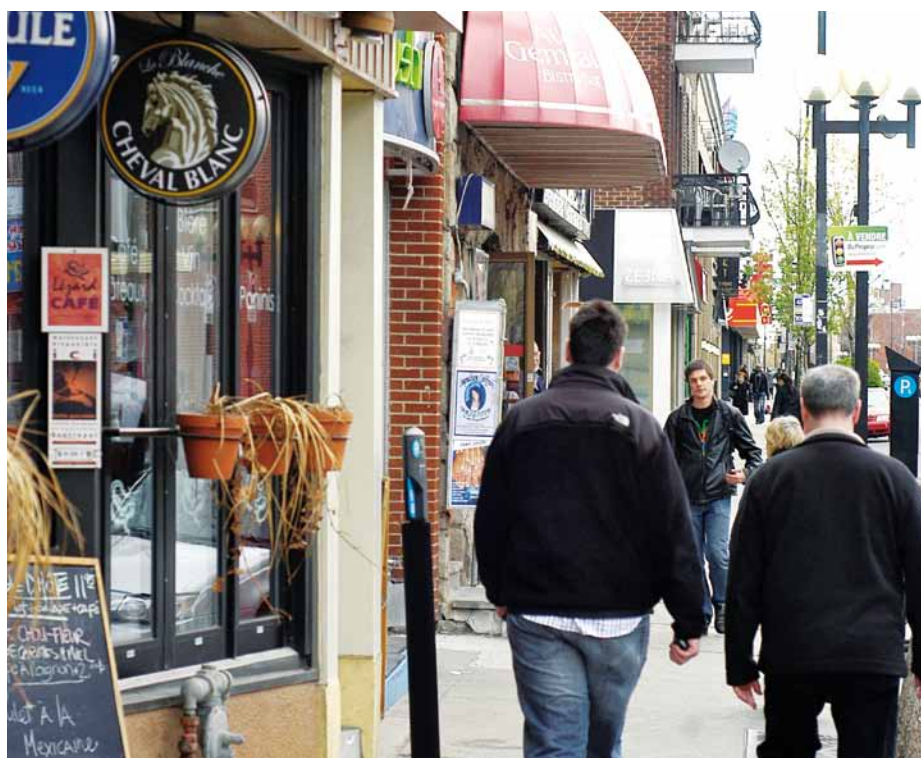
Un coup de pouce de la Ville pour embellir nos artères commerciales.

Dans notre arrondissement, la Promenade Masson, la Plaza St-Hubert, la Petite Italie et les environs du marché Jean-Talon ainsi que la rue Beaubien, entre la 35 e et la 41 e Avenue, sont admissibles au programme Réussir à Montréal (PR@M). La subvention peut atteindre le tiers du coût des travaux admissibles, pour un maximum de 33 000$.