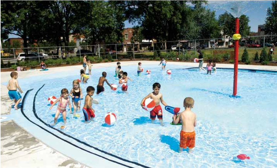
Belles et invitantes, les dix pataugeoires de l'arrondissement rafraîchissent les enfants. Ci-dessus, la pataugeoire du parc du Pélican.