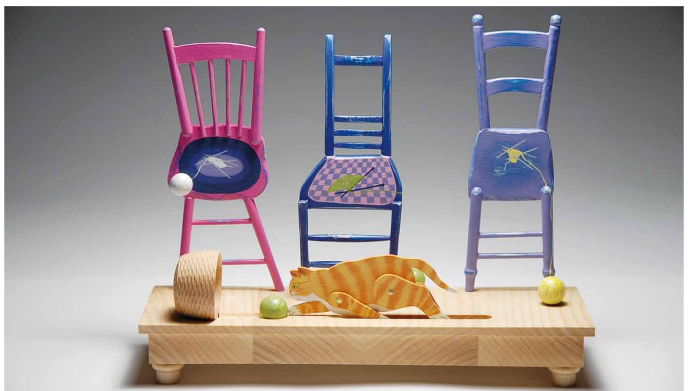
L'exposition Jouer avec Michel Tremblay , une des nombreuses activités proposées par votre maison de la culture.