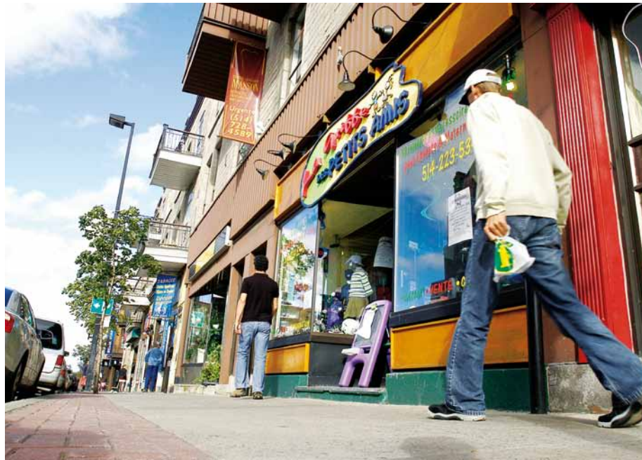
La piétonnisation de Masson, une réalité dès le printemps prochain.

Les détails concernant la durée et l'étendue de la piétonnisation sont présentement à l'étude.