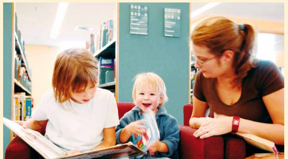
Cet été, toutes sortes d'activités attendent les enfants dans les bibliothèques!

Activité réalisée grâce au soutien du Conseil des Arts du Canada et des Amis de la Bibliothèque de Montréal.