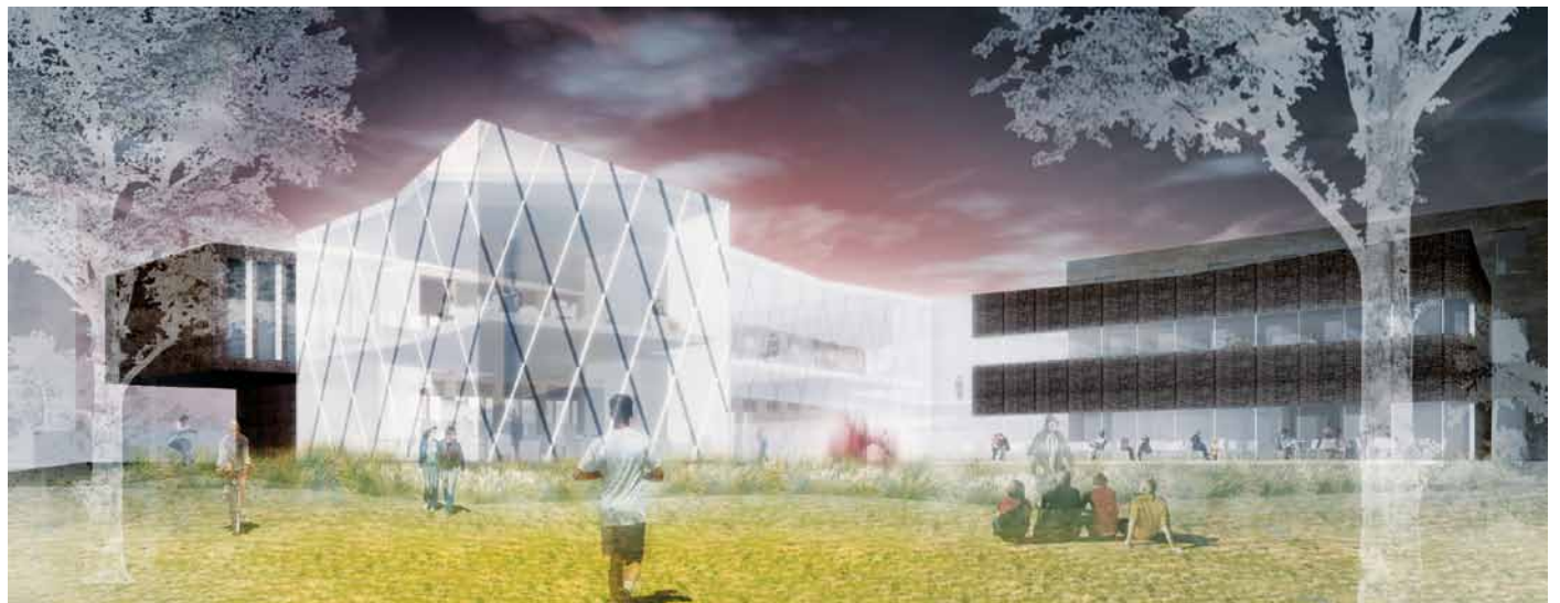
Esquisse de la future bibliothèque réalisée par la firme Dan Hanganu, architectes, lauréate du concours d'architecture.

La firme qui réalisera le projet est Dan Hanganu, architectes. Celle-ci a remporté le concours d'architecture lancé à l'échelle de la province en 2009. L'ouverture de la bibliothèque est prévue en 2012.