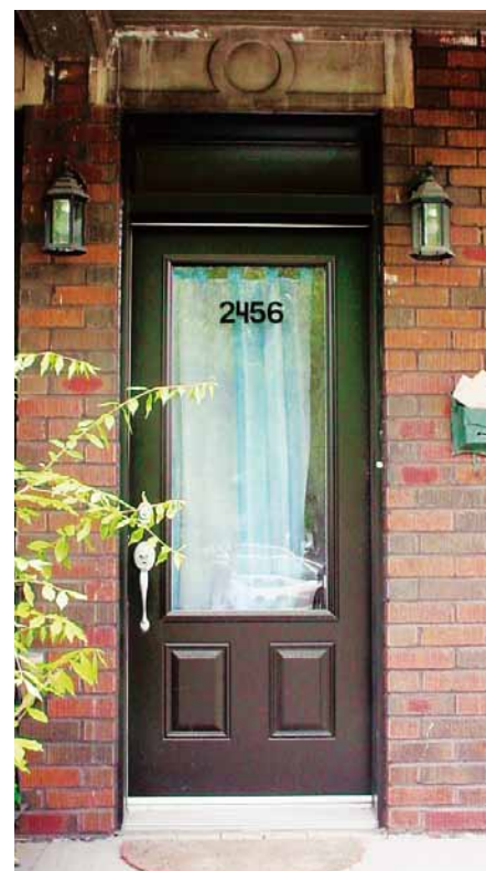
Nouvelle porte respectant les caractéristiques d'origine.

* Ces éléments ne nécessitent pas de permis, mais leur implantation est soumise à une réglementation. Informez-vous auprès de notre personnel. Téléphone: 514 868-3566