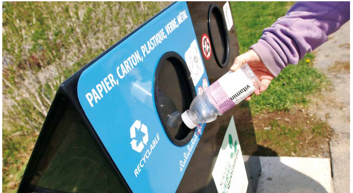
Ils sont visibles et très pratiques : les nouveaux îlots de récupération.

Des îlots identiques ont également été placés dans les installations de sport et de loisir, et le succès est déjà au rendez-vous.