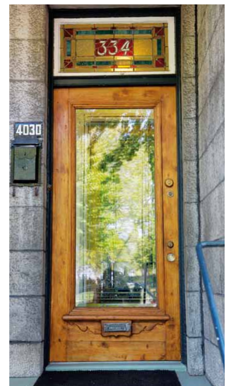
Porte d'origine restaurée.