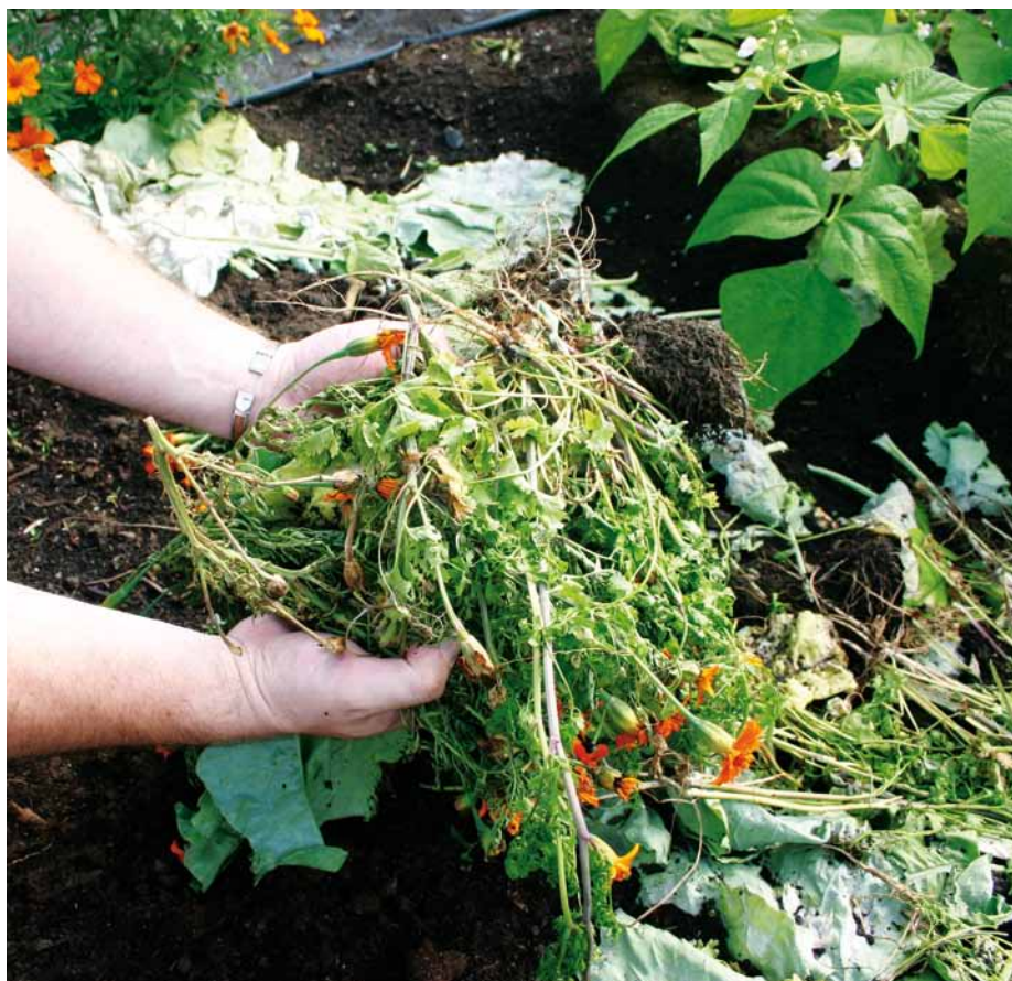
La collecte des résidus verts passe devant chez vous. Profitez-en!