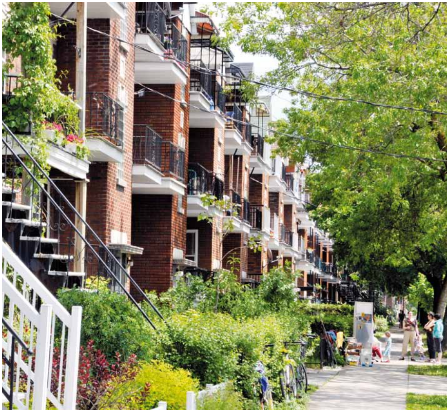
Gardons nos rues verdoyantes en protégeant adéquatement nos arbres.