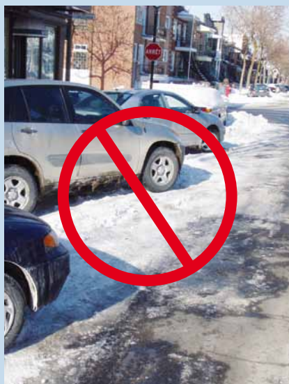
Les véhicules mal stationnés entravent les opérations de déneigement.