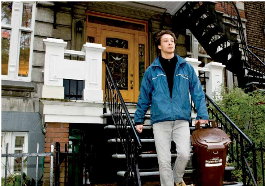
Depuis le début du projet, les 20 000 foyers participants ont contribué à détourner de l'enfouissement 643 tonnes métriques de résidus, soit une moyenne de 1,45 kilo par ménage par semaine.

Pour connaître les nouveaux secteurs desservis, consultez la carte publiée sur le site de l'arrondissement : ville.montreal.qc.ca/rpp .