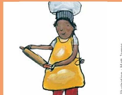
Illustration : Matt James