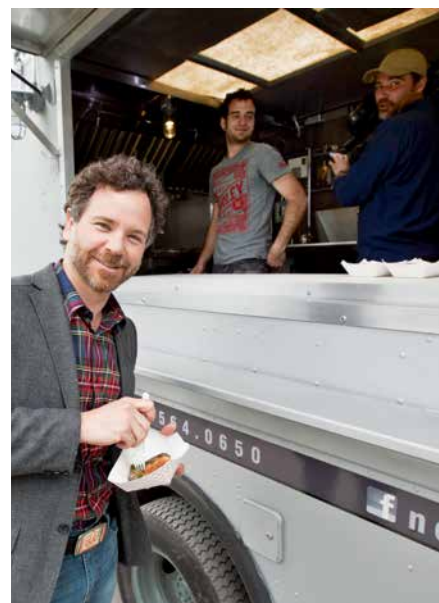
Le maire, François William Croteau, lors de l'annonce officialisant la présence de la cuisine de rue dans l'arrondissement cet été.

D'autres événements seront proposés au cours des prochaines semaines, notamment par l'Association des restaurateurs de rue du Québec qui est déjà partenaire de l'arrondissement dans le cadre des soirées de cinéma en plein air.