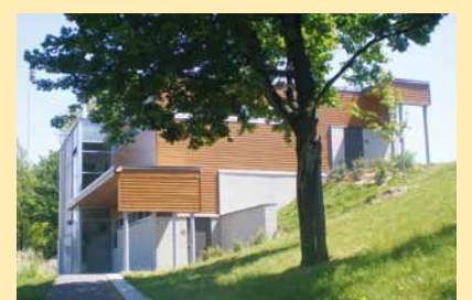
D'allure contemporaine, le chalet comporte de nombreuses caractéristiques écologiques.