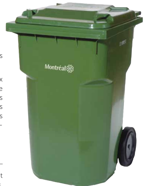
Des bacs plus grands avec couvercle pour éviter les débordements et améliorer la propreté des rues

Quant aux résidus verts de jardin, ils sont ramassés à l'automne, tous les mercredis, du 15 septembre au 17 novembre.