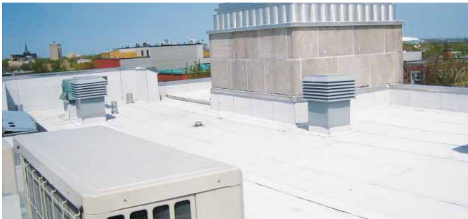
L'aménagement de toits blancs, tel que cela a été fait à la bibliothèque Rosemont, est un outil efficace de lutte contre les îlots de chaleur.