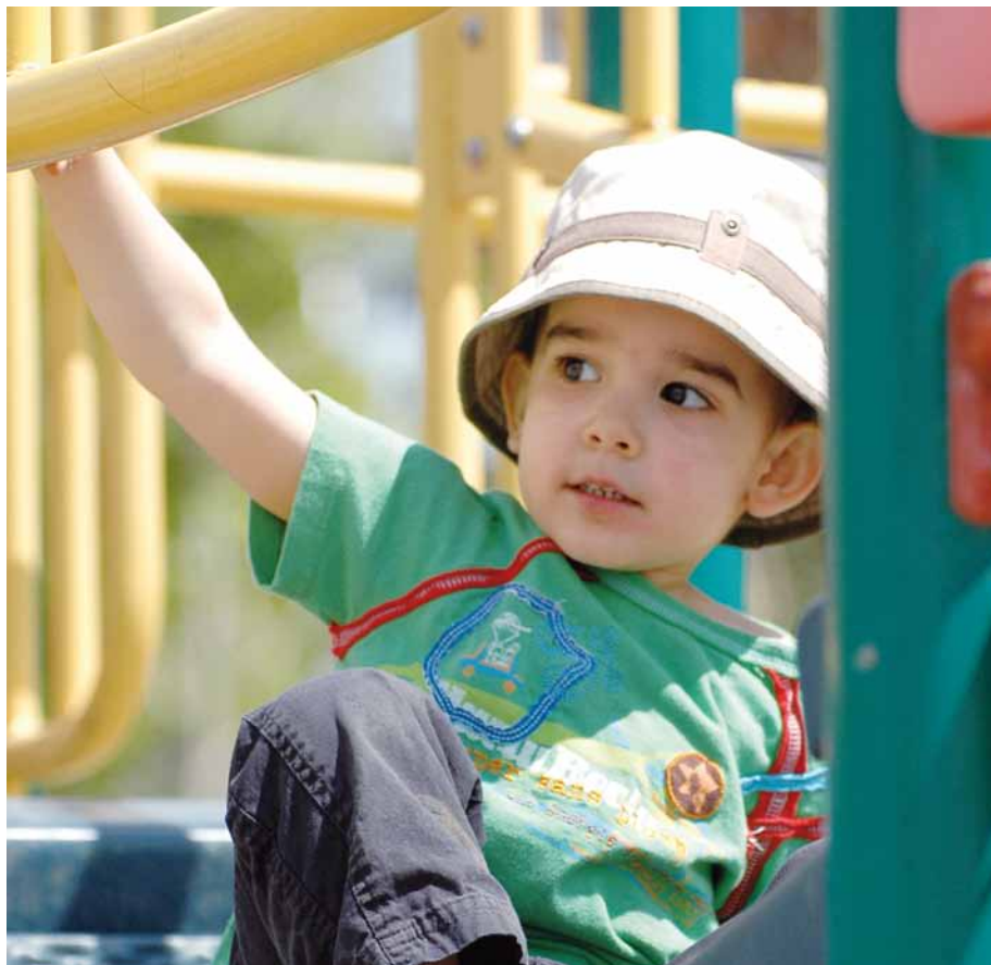
Des heures de plaisir pour les enfants dans les parcs de l'arrondissement.