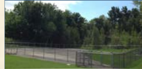
Dog Park on des Bruants Street.

An amount of $300,000 was planned to replace some vehicles in our fleet. This amount was mainly used in 2016, as 2015 was mostly dedicated to preparing tenders.