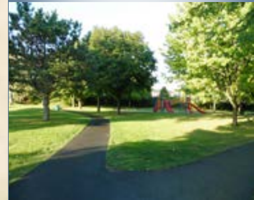
Joseph-Avila Proulx Park