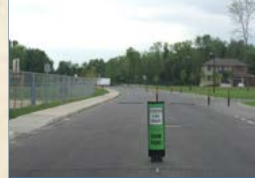
Traffic-calming measures on Chevremont Boulevard.

Acquisition project of a land bordering the Prairies River in Sainte-Geneviève, in order to create a new waterfront park.