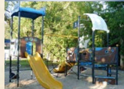
New playground at Saint-Pierre Park.