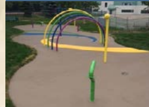
Splash pad at Jonathan-Wilson Park.