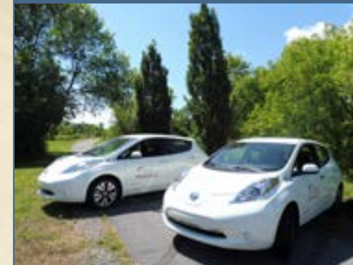
Les deux nouvelles voitures électriques Nissan Leaf seront principalement utilisées par le personnel des travaux publics.