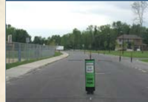
Mesures d'apaisement de la circulation sur le boulevard Chevreumont.

Projet d'acquisition d'un terrain en bordure de la rivière des Prairies, pour en faire un site riverain à Sainte-Geneviève.