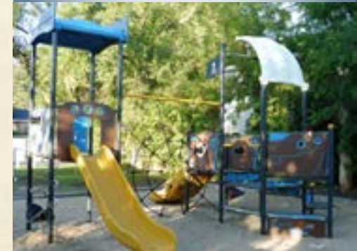
Nouveaux jeux au parc Saint-Pierre.