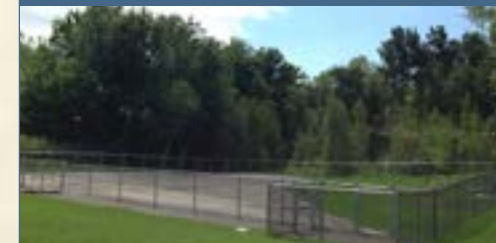
Aire d'exercice canin sur la rue des Bruants.

Une somme de 300 000 $ avait été prévue pour le remplacement des véhicules. Cette somme a principalement été utilisée en 2016, car l'année 2015 a été consacrée à la préparation des appels d'offres.