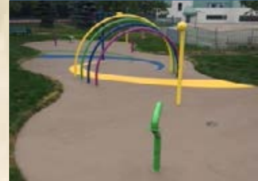
Jeux d'eau au parc Jonathan-Wilson.