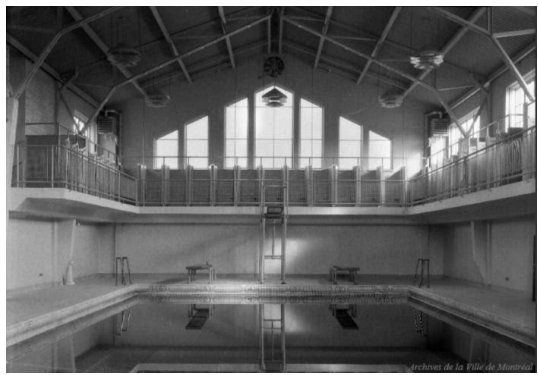
Intérieur du Bain Hogan en 1931.

Que sont des vespasiennes ? Où as-tu trouvé cette information ?