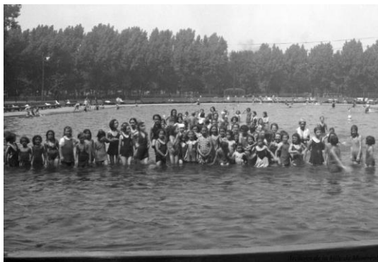
Parc Lafontaine (années 1930)

En quelle année a lieu le premier cours de natation ?