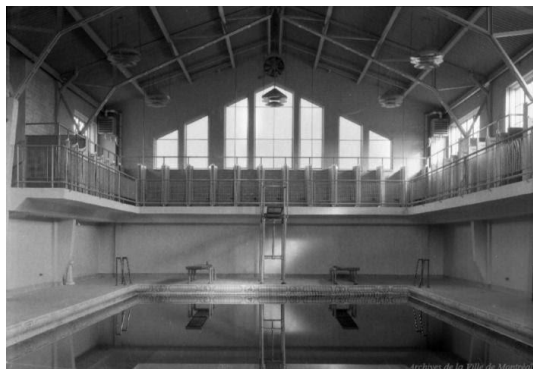
Intérieur du Bain Hogan en 1931.

Que sont des vespasiennes ? Où as-tu trouvé cette information ?