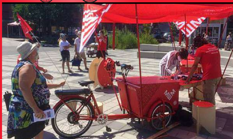
La Placette Côte des Neiges