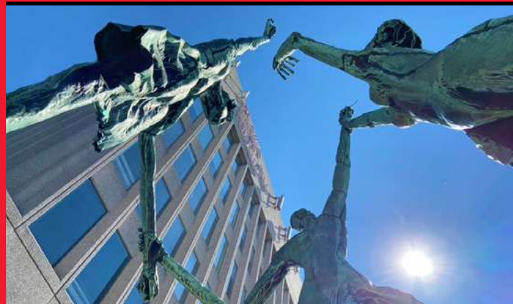
À la découverte de l'art public de NGD

« Travaillant à titre d'animateur - médiateur pour le Musée de Lachine depuis 2014, j'ai développé une passion pour l'art public moderne et contemporain. Ces oeuvres, accessibles à tous et toutes en tout temps, sont d'excellentes manifestations artistiques de démocratie culturelle ( idée de donner accès à l'art et la culture à l'ensemble de la population) en plus d'être, bien souvent, liées à l'histoire du lieu où elles sont installées. C'est donc avec grand plaisir que j'ai pu découvrir deux oeuvres d'art public situées près du parc Martin Luther King. »