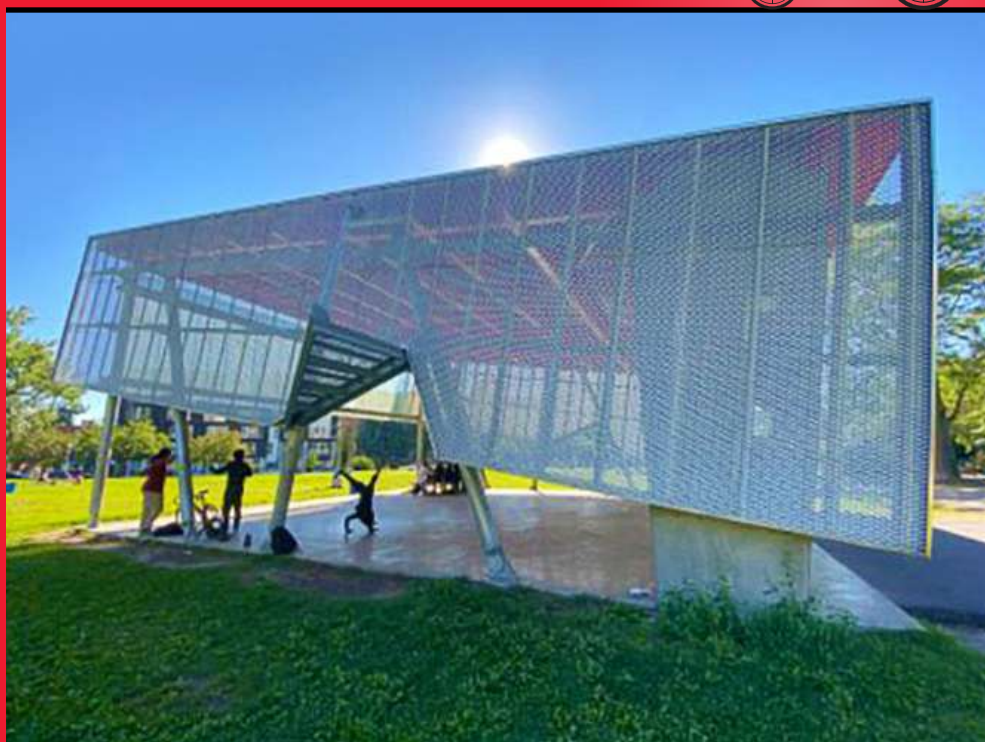
Ça danse au parc Jean Brillant à Notre-Dame de Grâce