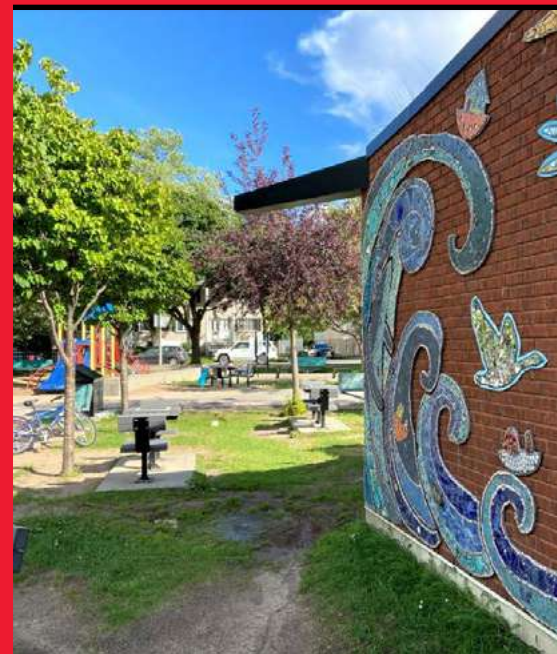
Le parc Painter, le parc Güell de Saint-Laurent