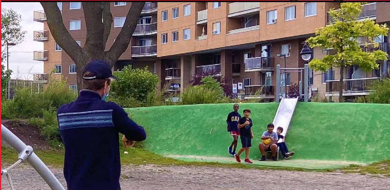
Partie de soccer avec des enfants du quartier, près de notre installation sur la Place Acadie.