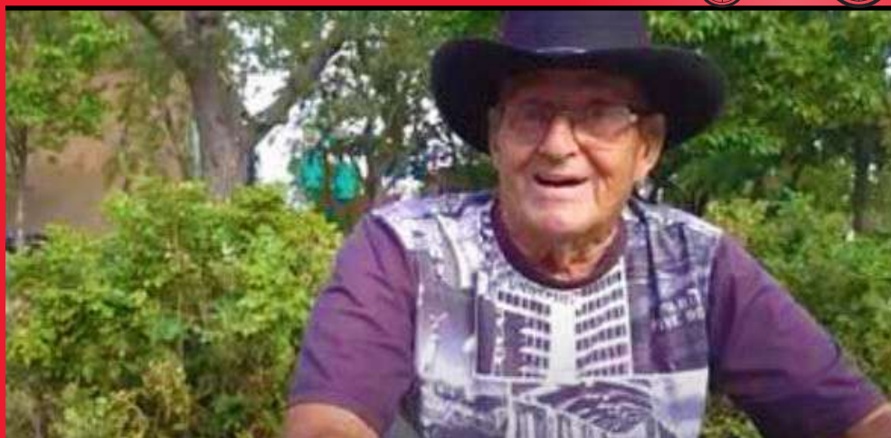
La Place, le chalet communautaire du parc Montcalm