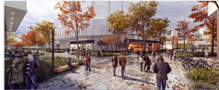
PPU, Partie nord de l'Île-des-Soeurs