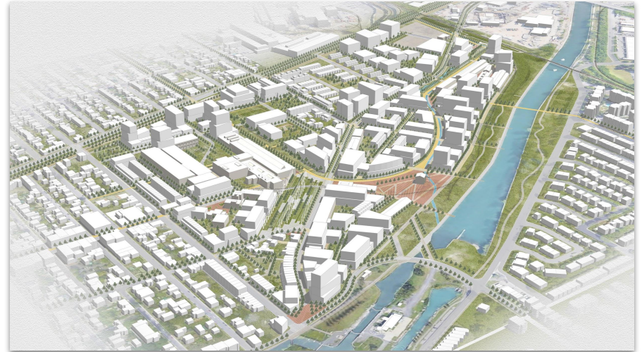
Plan d'ensemble de l'écoquartier