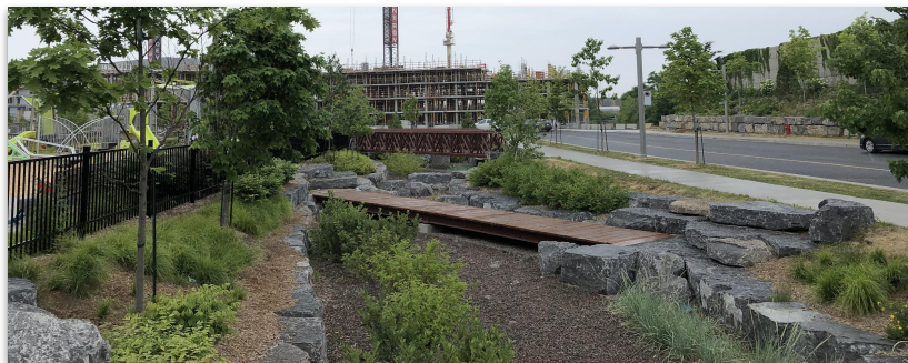
Jardins de pluie, parc Pierre-Dansereau, MIL Montréal