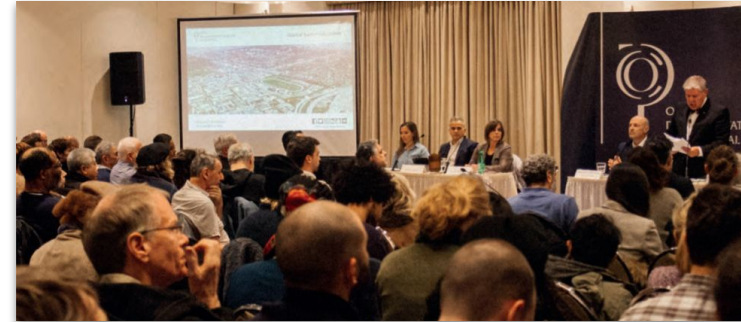
Consultation publique OCPM, Quartier Namur-Hippodrome