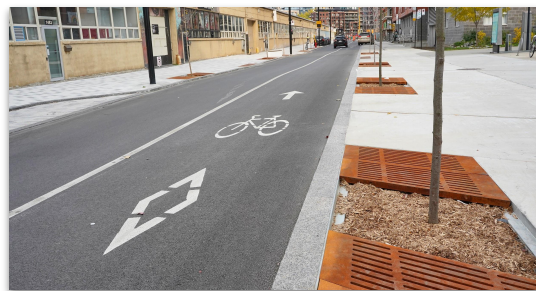
Nouveaux lien cyclable et aménagement piétonniers, rue Ottawa, Griffintown