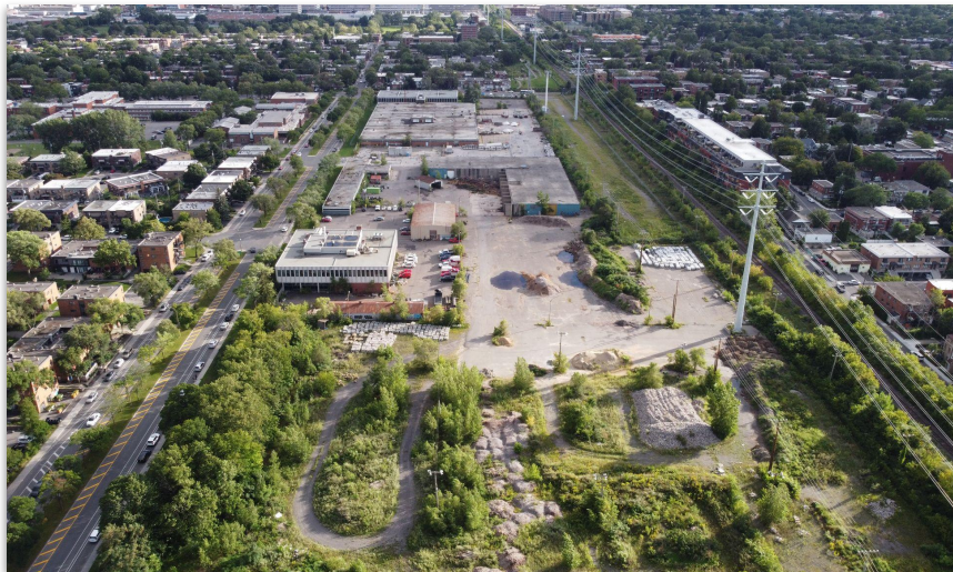
Site actuel, Louvain Est

Aménagement sur cette ancienne cour de voirie municipale, d'un écoquartier exemplaire et solidaire qui s'inscrira dans la transition écologique et qui contribuera à la résilience de la communauté de l'ensemble du secteur