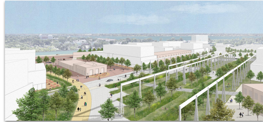
Vision pour un place des ponts roulants, Lachine Est