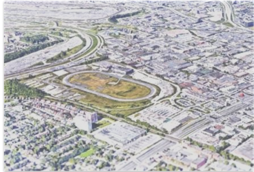
Site de l'ancienne hippodrome, futur écoquartier Namur-Hippodrome