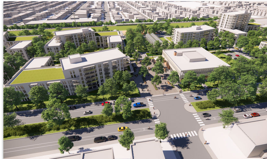
Place publique dans l'axe de la rue Olivier-Maurault, Louvain Est