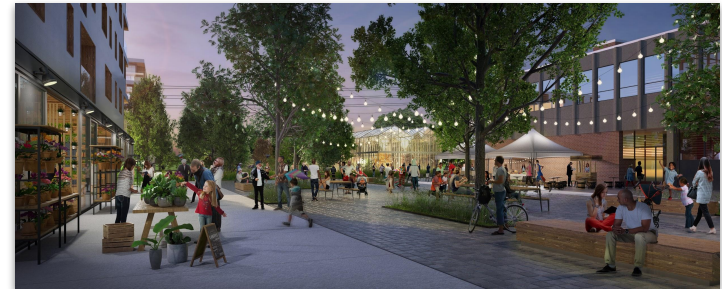
Place publique au coeur de l'écoquartier