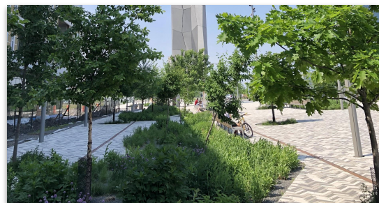
Verdissement, Place Alice-Girard