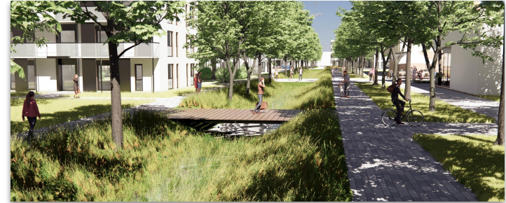
Coulée verte et blanche