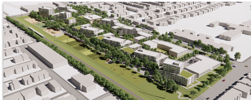
Orientation des bâtiments pour l'ensoleillement, Louvain Est