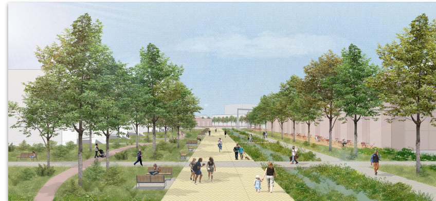
Réseau actif et parcs, Lachine Est