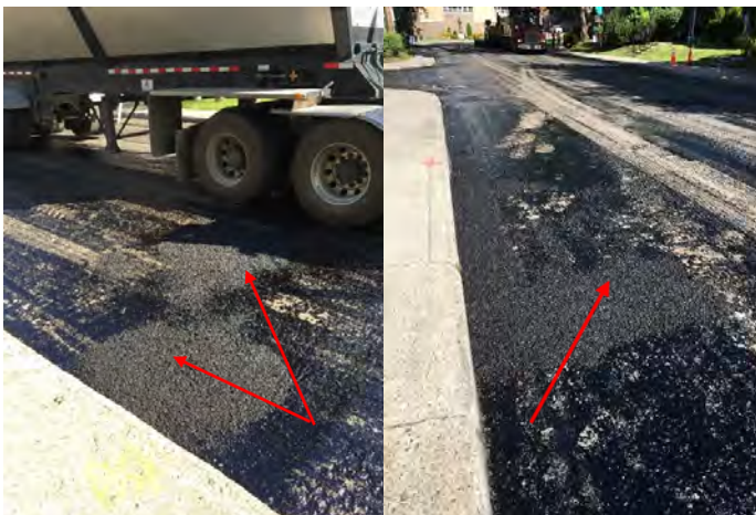
Emrobés bitumineux non-compactés

Bien que les corrections des défauts aient été effectuées, le Bureau de l'inspecteur général a observé sur un (1) chantier qu'il n'y a eu aucune compaction de l'enrobé par rouleau pour obtenir le degré de compaction exigé au devis. Le surveillant étant absent, il n'a pas pu vérifier si le bon mélange a été utilisé.