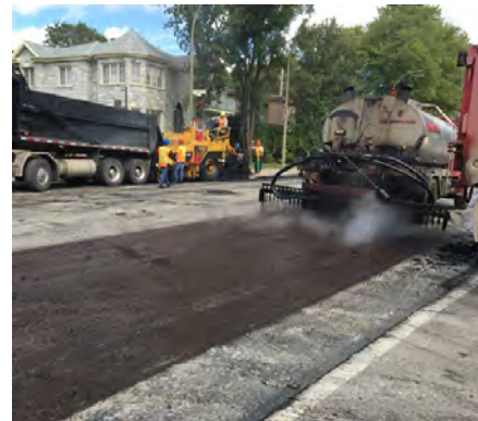
Pose conforme du liant d'accrochage

Si la surface préparée à l'émulsion de bitume est salie par la circulation, l'entrepreneur devra prévoir à nouveau une préparation de surfaces de contact dont le coût devra être compris dans le prix au mètre carré des revêtements bitumineux.