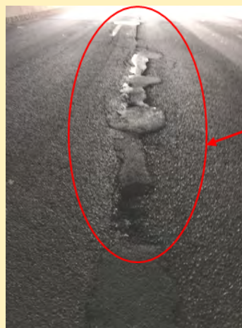
Conséquences d'un joint longitudinal

Au point de vue de la qualité des travaux, un joint longitudinal nuit à la durabilité du revêtement. En effet, le joint devient une zone de faiblesse où l'eau s'infiltre. Par les cycles de gels et dégels, des fissures apparaissent alors dans la chaussée.