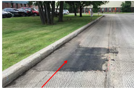
Correction d'un défaut ponctuel réalisée selon les exigences du devis

Les chargés d'enquête du Bureau de l'inspecteur général ont constaté sur plusieurs chantiers que les surveillants manquaient de rigueur et n'assumaient pas pleinement leur rôle dans la réparation des défauts.