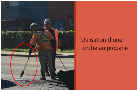
Utilisation d'une torche au propane

Le surveillant a accepté la réparation d'un défaut de joint froid en utilisant une torche à propane au lieu de l'adhésif exigé au devis.