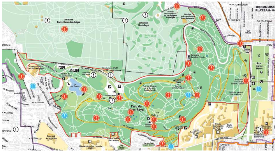
Carte des Amis de la montagne montrant la ramification de sentiers secondaires