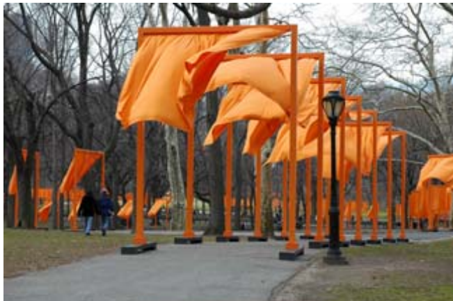
Christo et Jeanne-Claude, The Gates , 2005 Central Park, New York

Ultérieurement, quand le secteur du Boisé sera complété, il accueillera des œuvres d'art que les citoyens pourront apprécier le long de ces circuits.