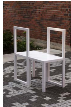
Robert Wilson, Kate & Nora , 2013 place Kate-McGarrigle, arr. d'Outremont