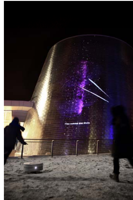
Daily tous les jours, Chorégraphie pour les humains et les étoiles , 2013 Planétarium Rio Tinto Alcan de Montréal, arr. de Mercier-Hochelaga-Maisonneuve