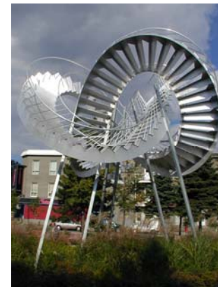
Révolutions (2003) de Michel de Broin a été commandée pour 130 000$ et est évaluée aujourd'hui à 485 000$