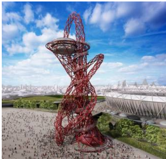
Anish Kapoor, Orbit , 2012, Parc Olympique, Londres

Situés en bordure de la couronne et du centre du parc, ils auront, en plus d'autres fonctions utiles (belvédère, escalier, interprétation, etc.), le rôle d'indiquer des points d'accès du parc et de faciliter ainsi l'orientation des usagers dans l'espace.