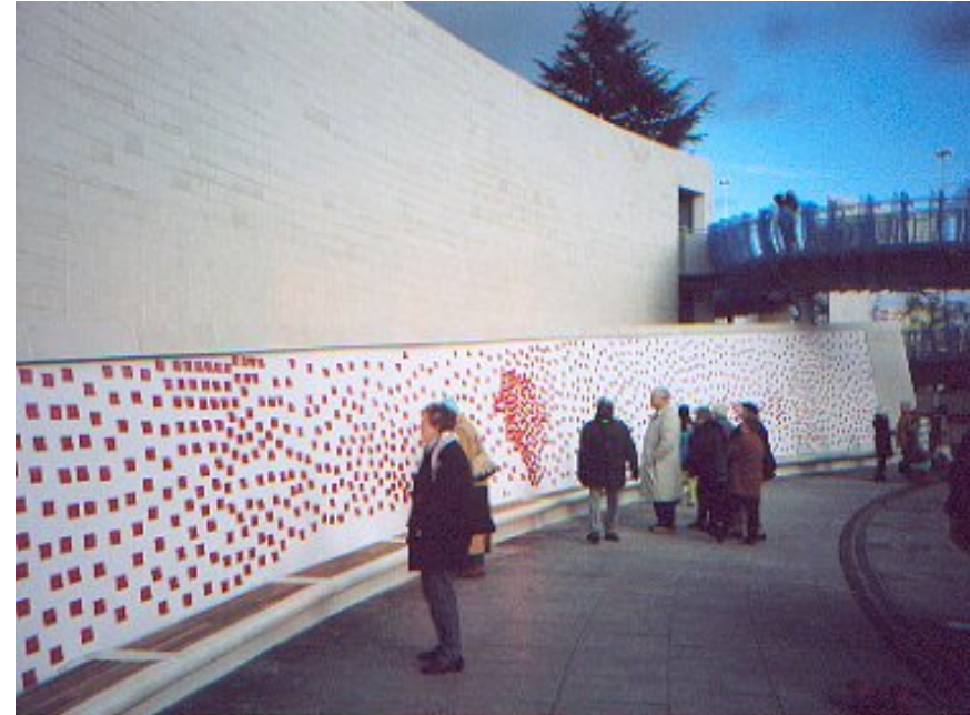
Jochen Gerz, The Public Bench (2004) Millennium Place, Coventry, Angleterre