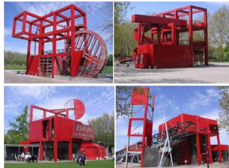
Bernard Tschumi, Les Folies Parc de la Villette, Paris