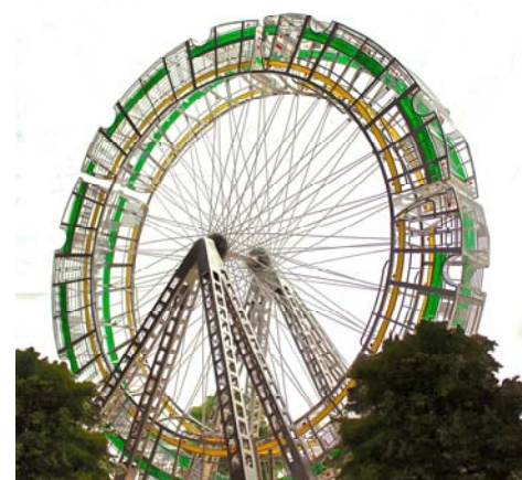
BGL, La vitesse des lieux , 2015 Carrefour Henri-Bourassa – Pie-IX, arr. de Montréal-Nord

Réalisation d'activités ponctuelles de médiation pour aller à la rencontre des citoyens