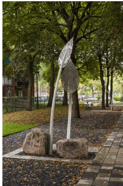
Luce Pelletier, L'étreinte , 2013 Parc Toussaint-Louverture, arr. de Ville-Marie

Réalisation d'une œuvre avec l'implication de la communauté