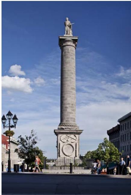
Robert Mitchell, Monument à Nelson , 1809 Place Jacques-Cartier, arr. de Ville-Marie

Modes d'acquisition : commandes, dons, achats, transferts, dépôts Sculptures, installations, aménagements, photographies, numériques