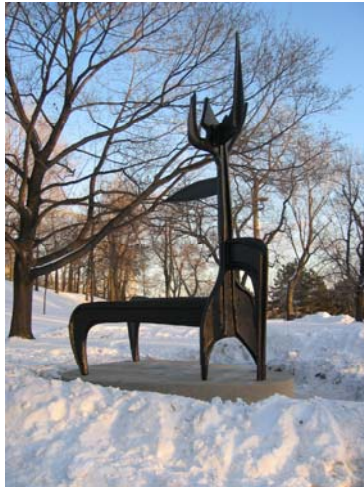
Migrations (1967) de Robert Roussil a été commandée pour 20 000$ et a été évaluée en 2003 à 300 000$