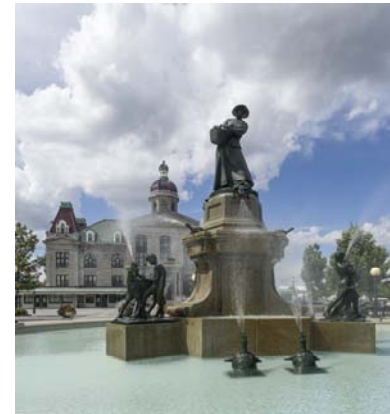
La fermière (1915) d'Alfred Laliberté est évaluée à 1 500 000$