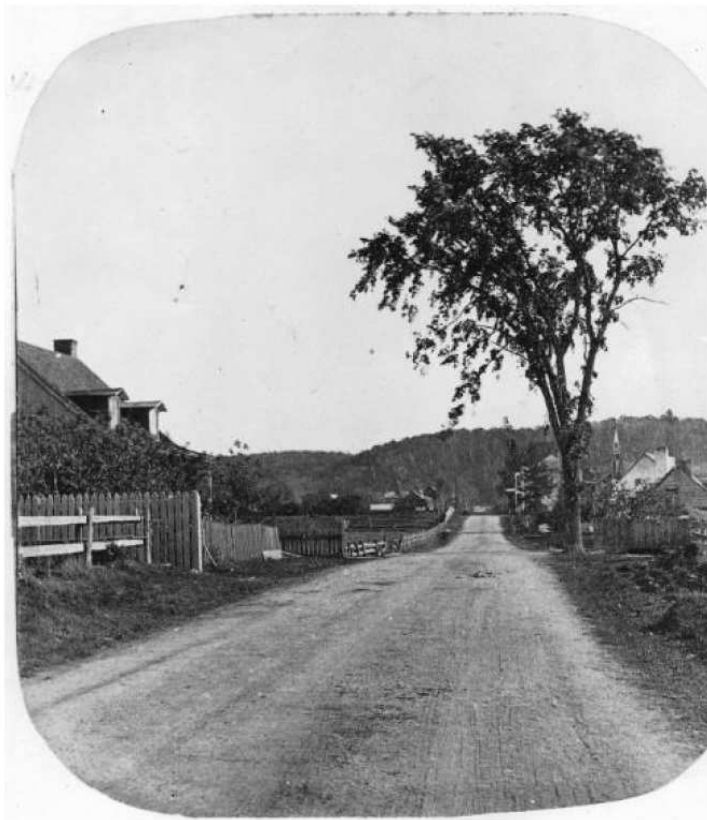
Chemin de la Côte-des-Neiges 1859