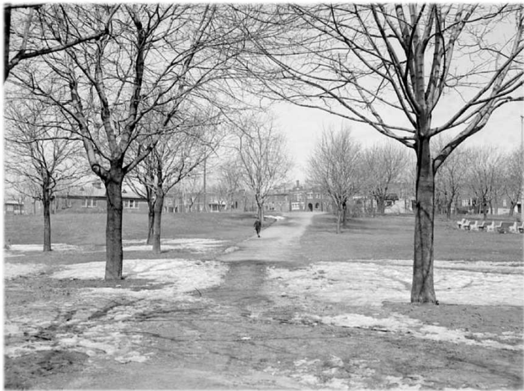
Parc Notre-Dame-de-Grâce, 1938