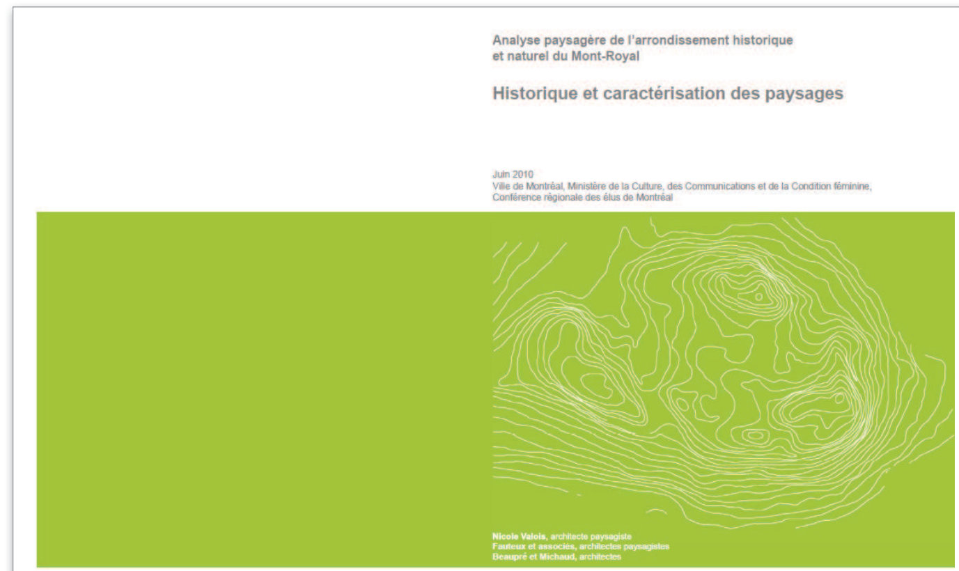
extrait _ PAGE COUVERTURE ET TABLE DES MATIÈRES