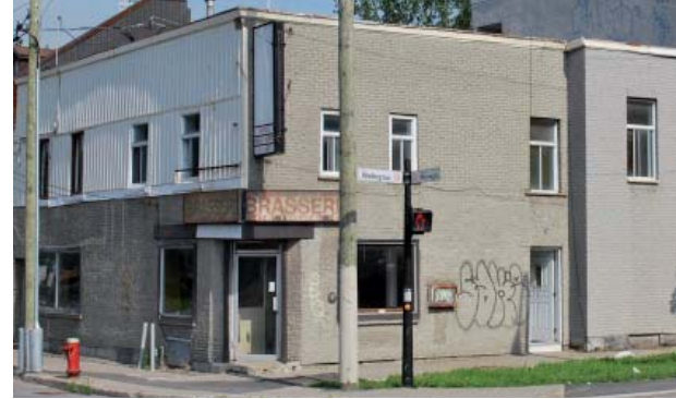
161-165, rue de la Montagne et 1201, rue Wellington