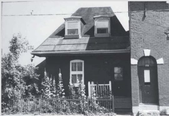
1982_ La maison au 175, rue de la Montagne

La valeur architecturale du site repose sur :