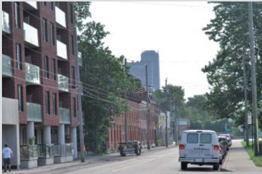
Le même ensemble, vu cette fois depuis la rue Ottawa au nord

La valeur paysagère urbaine du site repose sur :