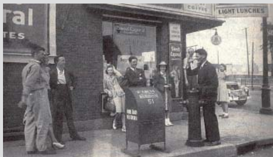
Devant McDonnell's

La valeur historique du site repose sur :