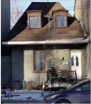
175, rue de la Montagne