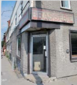
L'entrée en angle du commerce au coin