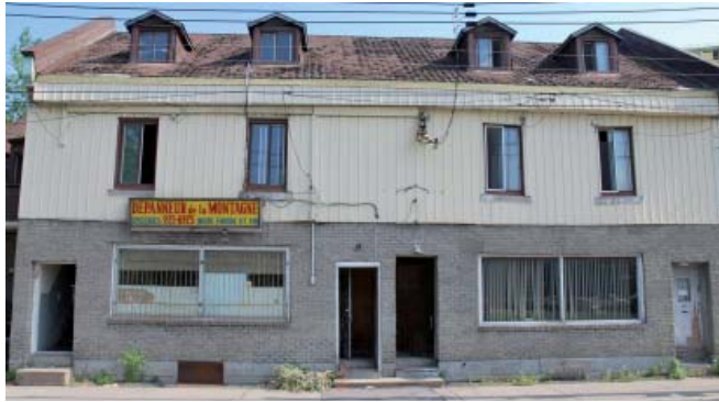
167-173, rue de la Montagne