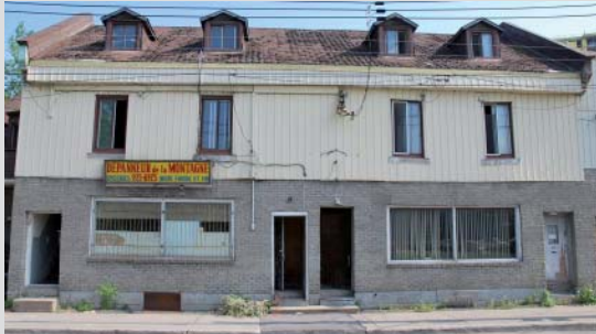
Une des façades (celle des 167-173, rue de la Montagne)