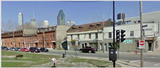
L'ensemble résidentiel bordant la rue de la Montagne - la moitié de droite correspond au site visé