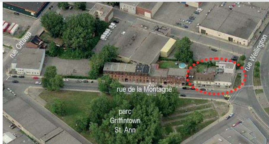
Vue aérienne. Le site est lisé en rouge