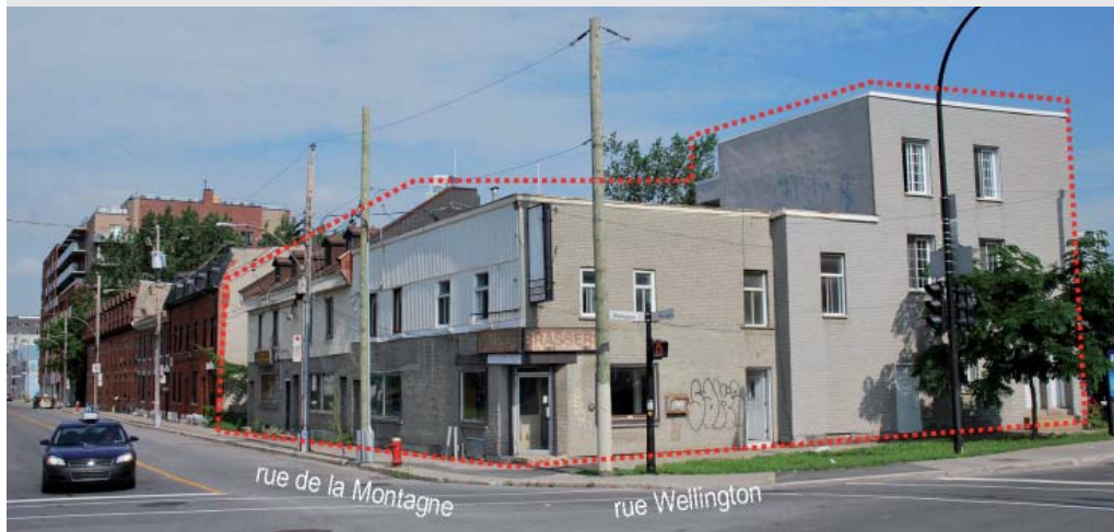
Le site à l'angle des rues de la Montagne et Wellington. La maison au 175, rue de la Montagne ne paraît pas car en retrait (à l'extrémité gauche du lisé)