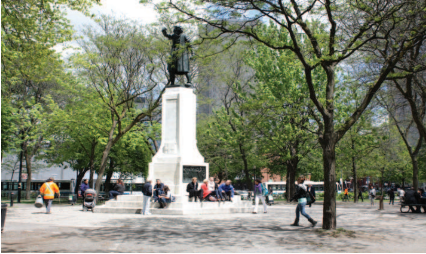
Le monument à Giovanni Caboto au centre du square Cabot

Désignation patrimoniale fédérale : Devant le Lieu historique national du Canada Forum-de-Montréal