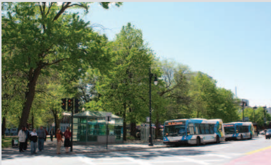
Portion du square face à la rue Sainte-Catherine

La valeur paysagère du square Cabot repose sur :