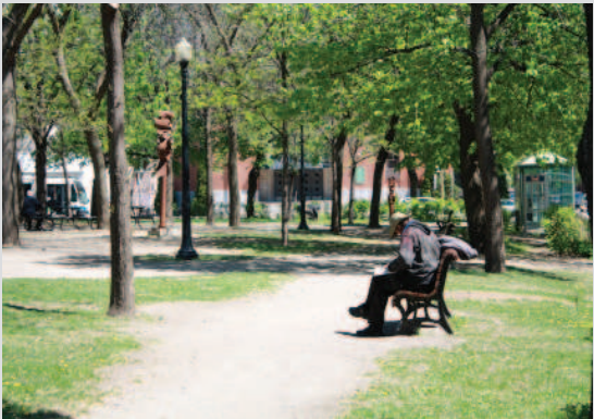
Usagers du square