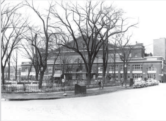
Le square Cabot et le Forum dans les années 1950

La valeur historique du square Cabot repose sur son témoignage :