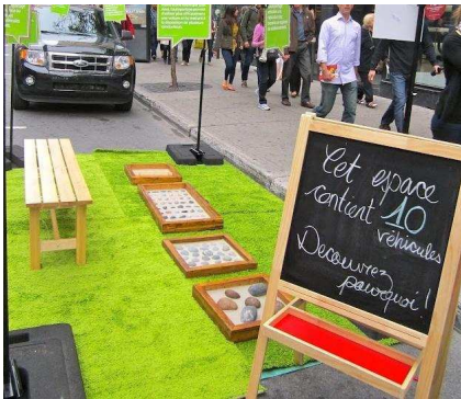
Communauto : Cet espace contient 10 véhicules