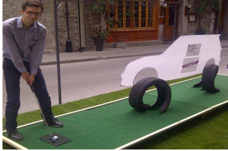
Groupe Conseil BC2FP Planex Consultants : PUTT(ing) DAY