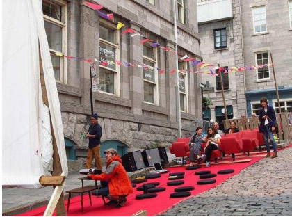
Association du design urbain de Québec : Ciné park(ing)