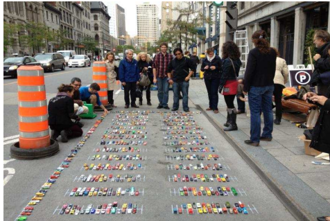
Martin-Marcotte Beinhaker Architectes / Antoine Mathys, Josée Dupuis, Pascal Beauchemin, Manuel Cisneros, Andrée Castegnier, Karine Leclerc : Mini parking