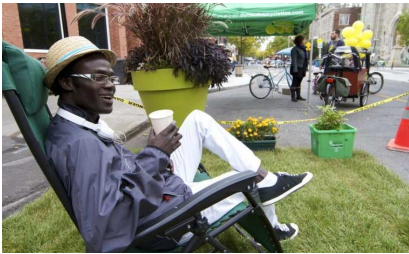
Arrondissement Villerey-Saint-Michel-Parc-Extension : Aire de repos