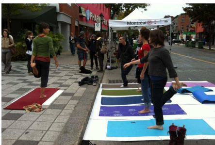
Éco-quartier Hochelaga / Éco-quartier Tétreaultville : Yoga