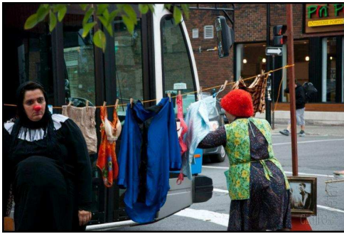
Toxique Trottoir : Théâtre de rue « Laver son linge en public »