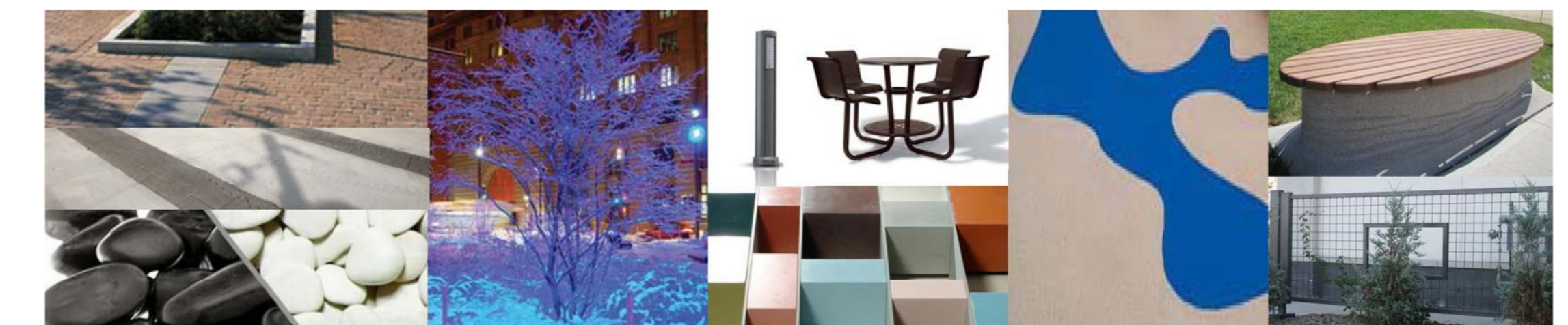
Matériaux et éclairage