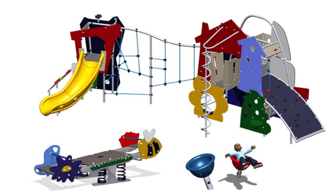
Appareils de jeu