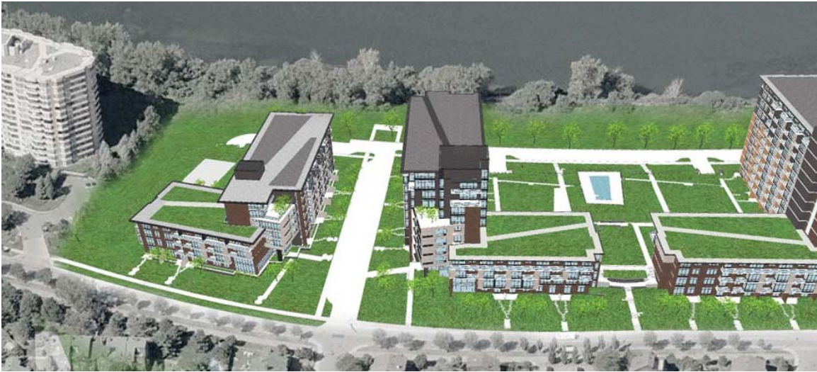
Modélisation 3D des phases I, II et III