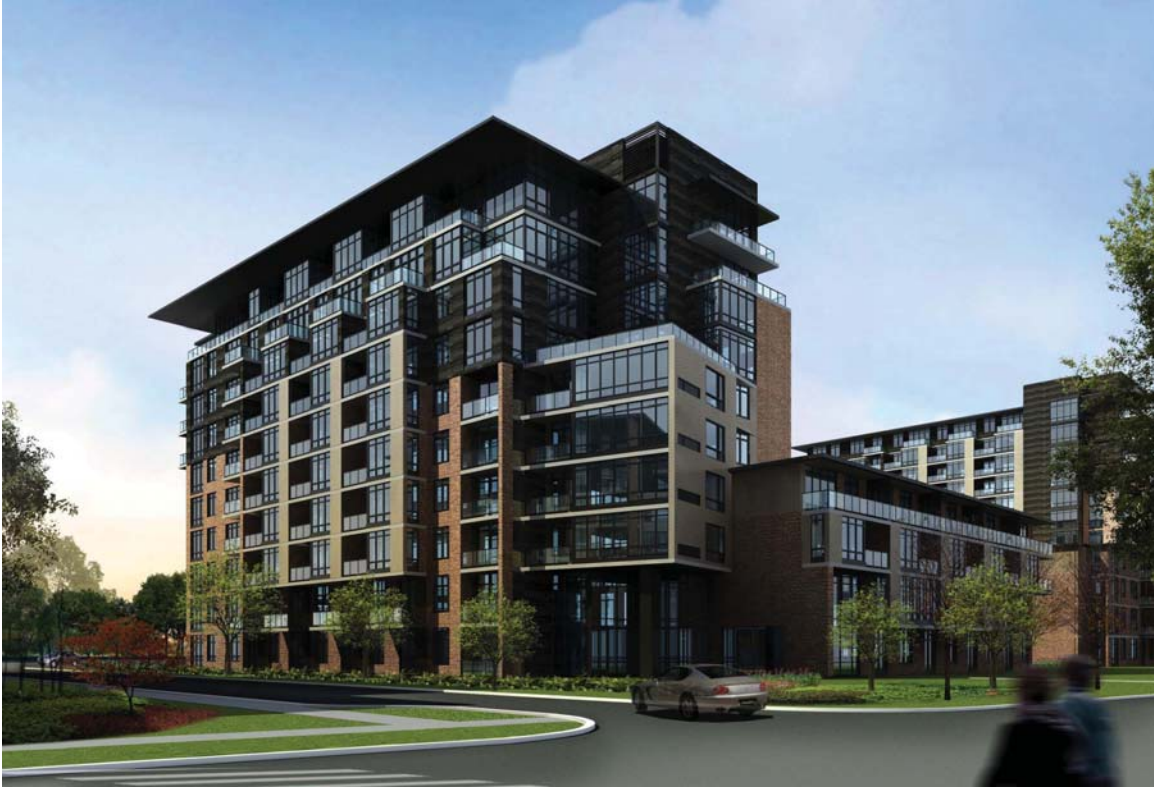
Perspective de la Phase II (vue chemin du Golf)