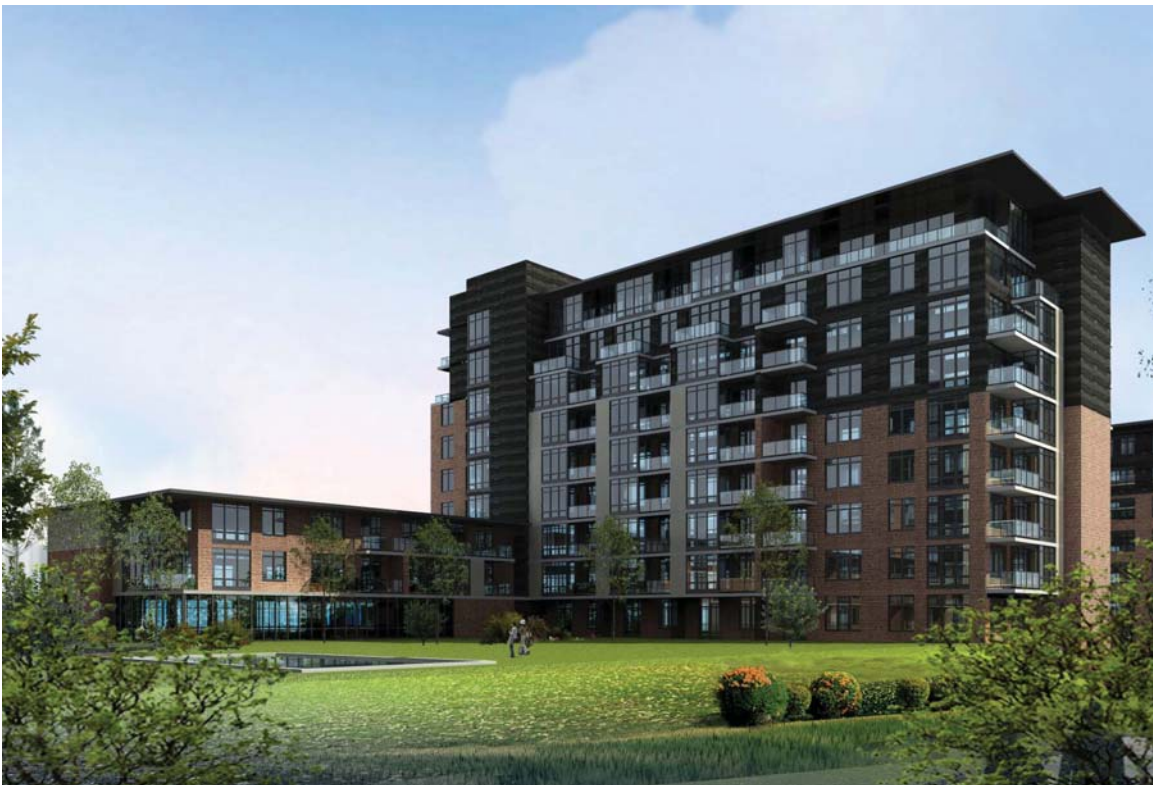
Perspective de la Phase II (vue de la cour intérieure, donnant sur les berges)