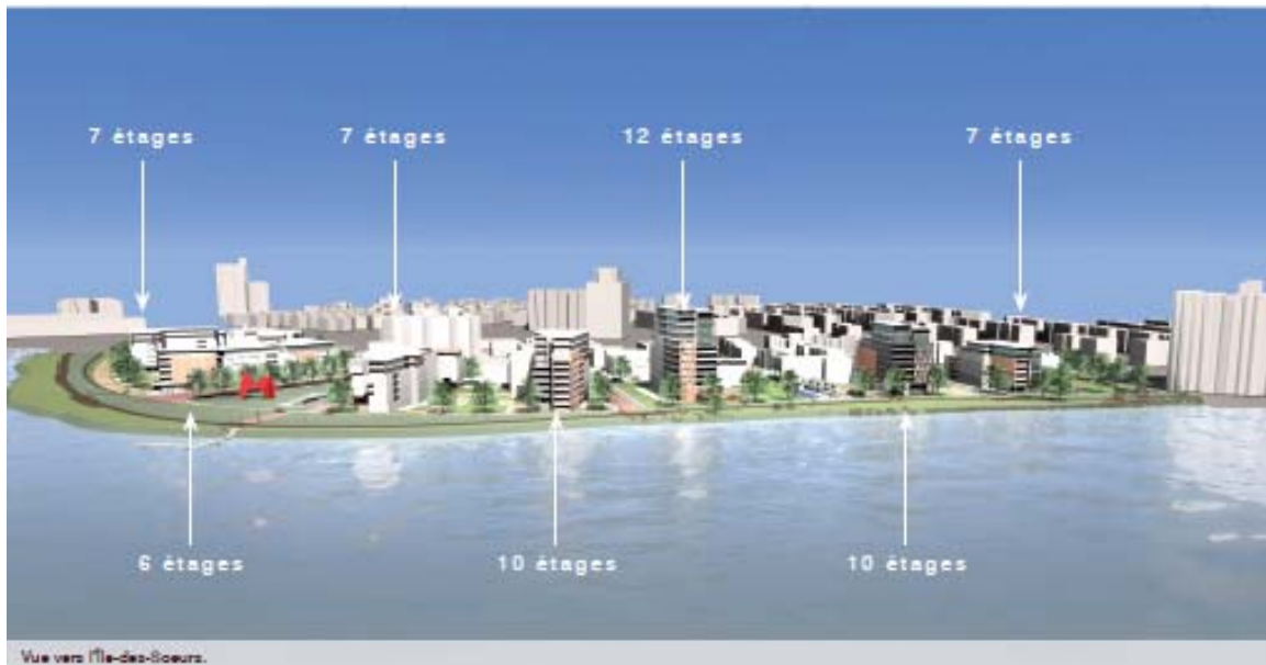
Vue vers L'Île-des-Sœurs indiquant la hauteur des différents bâtiments

6- Développement durable : la planification de tout le projet est basée sur les principes de conception, d'aménagement et de construction axés sur le développement durable.