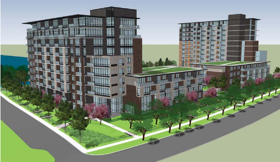
Modélisation démontrant l'aménagement paysager des phases II et III