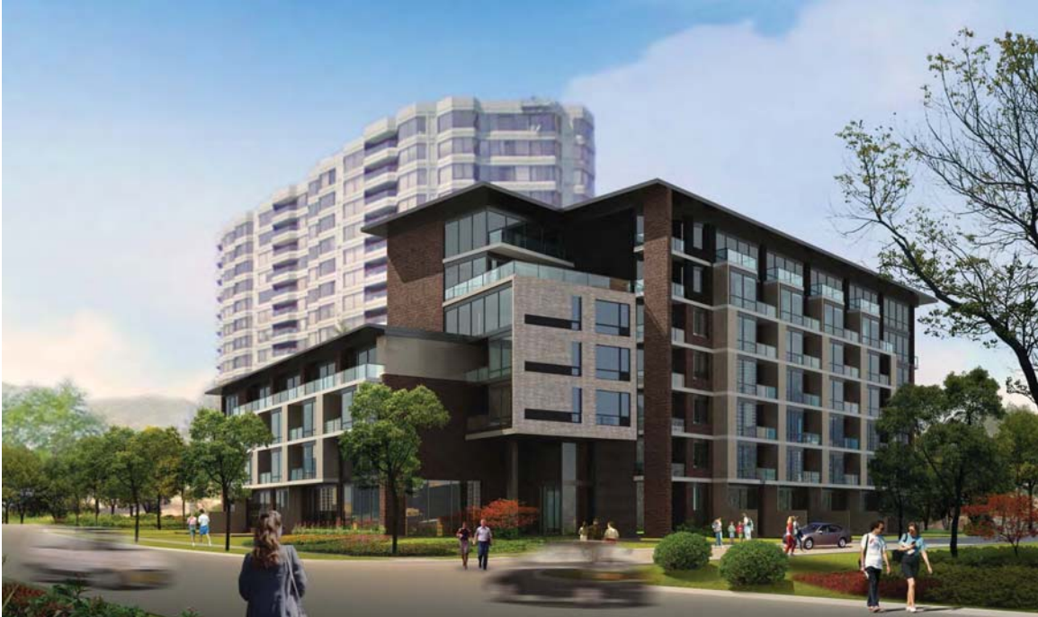
Perspective de la Phase I (vue du chemin du Golf)