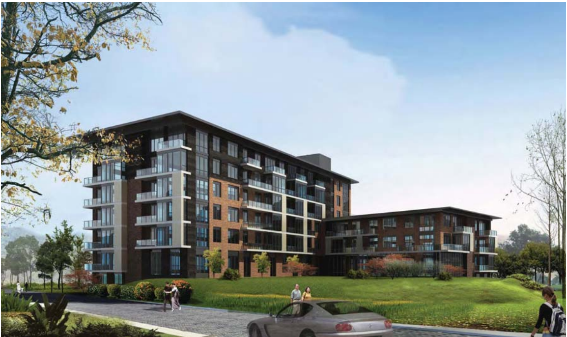
Perspective de la Phase I (vue de la cour intérieure, donnant sur les berges)