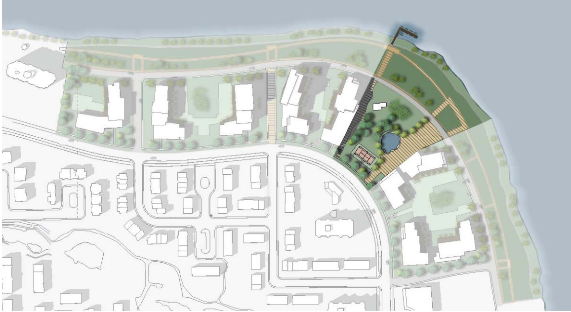
Vue de l'espace vert réservé à un parc public