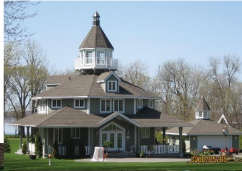
Usage : Unifamiliale isolée Type : Maison éclectique Date : 1998