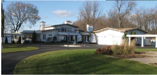
Usage : Unifamiliale isolée Type : Maison moderne Date : 1965