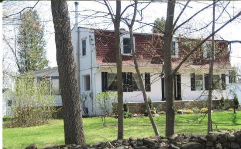
Usage : Unifamiliale isolée Type : Maison à toit mansardé Date : 1944