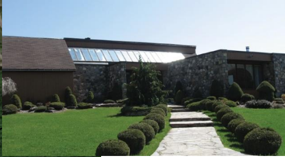
Usage : Unifamiliale isolée Type : Maison moderne Date : 1986