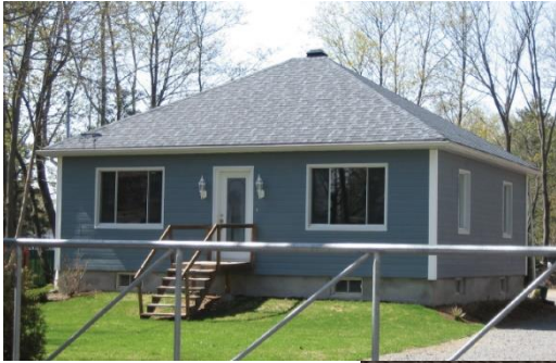
Usage : Unifamiliale isolée Type : Maison chalet Date : 1965