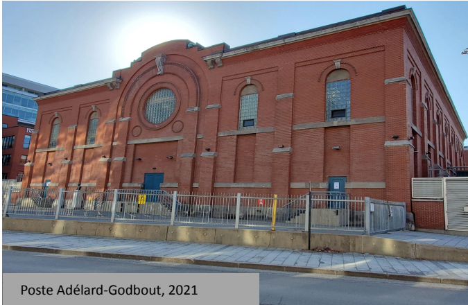
Poste Adélar-Godbout, 2021