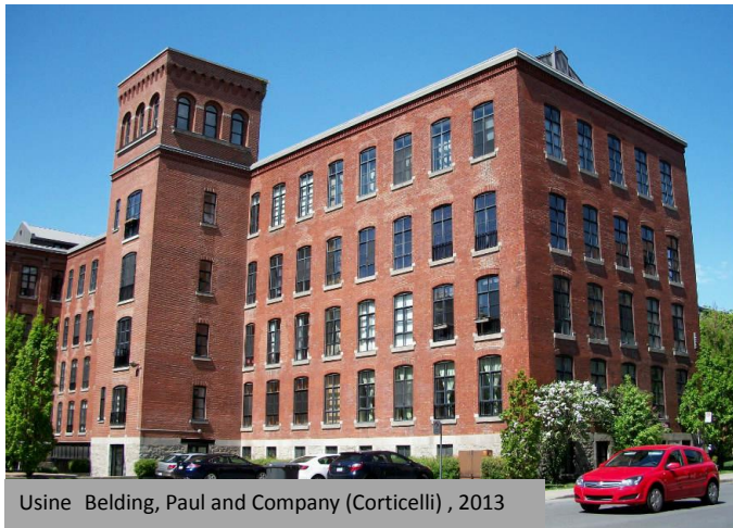
Usine Belding, Paul and Company (Corticelli), 2013