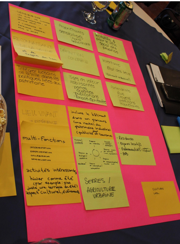
Atelier d'idéation de projets, congrès de l'Aqpi, 2018

- Créer une équipe pluridisciplinaire et transsectorielle qui puisse prendre appui sur les initiatives et les connaissances des institutions et des acteurs déjà engagés.