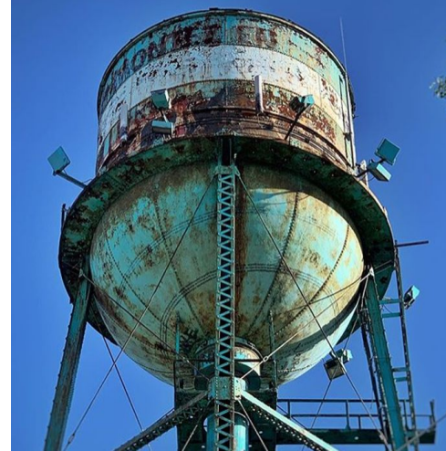
Château d'eau de la Congoleum Canada, 2019