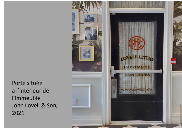
Porte située à l'intérieur de l'immeuble John Lovell & Son, 2021