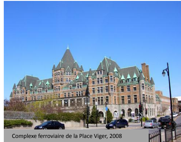
Complexe ferroviaire de la Place Viger, 2008