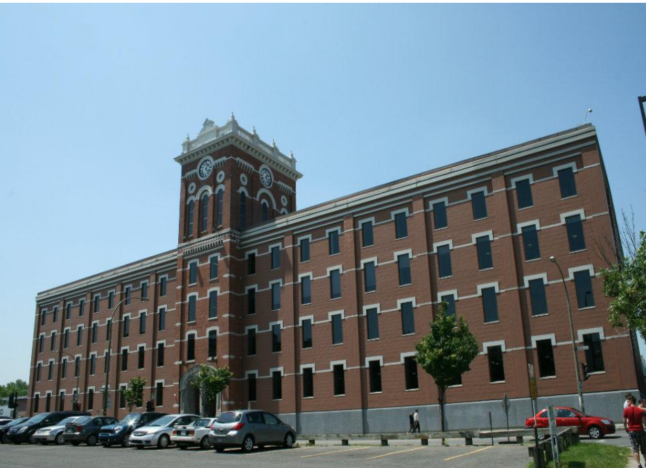
Usine Macdonald Tobacco, 2013

- Identifier les lieux industriels incontournables des différents quartiers montréalais en recourant à une grille d'analyse élargie et adaptée aux enjeux locaux.