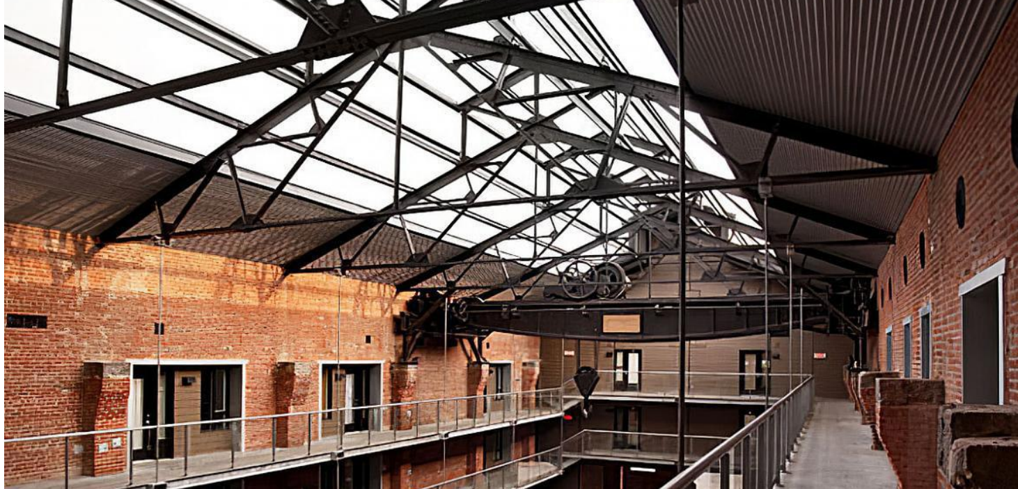
Intérieur de la Station n° 1, 2011 © Projets verts