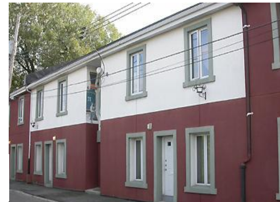
Anciennes maisons des ouvriers des Ateliers du grand tronç situées aux 422-444, rue de Sébastopol

- Documenter de manière plus approfondie les ensembles industriels d'intérêt en prenant en compte, notamment, les dimensions urbaines, architecturales, technologiques et immatérielles afin de démontrer l'intégration et la participation de ceux-ci au tissu urbain et à la mémoire collective des lieux.