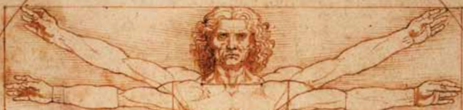
L'homme de Vitruve, Léonard De Vinci