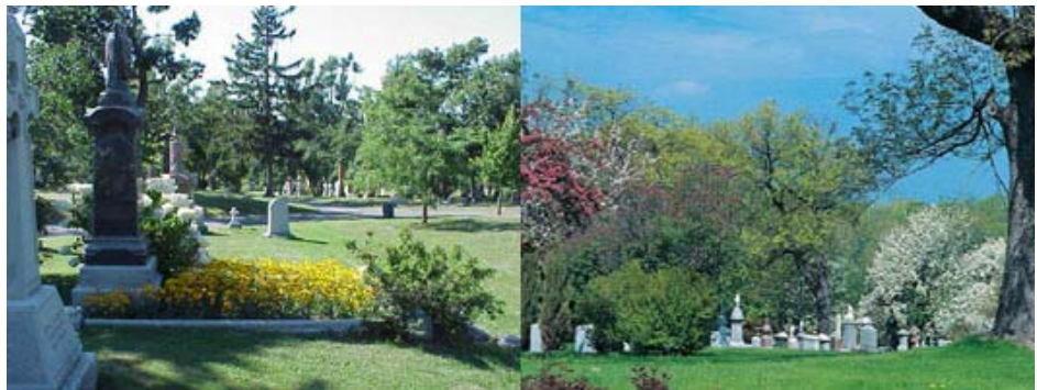
Figure 1. Deux vues sur les pelouses arborées du Cimetière Mont-Royal.

Le Cimetière Mont-Royal poursuit son développement et s'agrandit en annexant des parcelles de terrains voisins. À partir des années 1960, la clientèle protestante du cimetière est progressivement remplacée par de nouveaux montréalais de provenances diverses. Dans les années 1990, le Cimetière procède à un changement d'orientation et accentue son rôle historique en tant qu'institution pluraliste et lieu patrimonial naturel. La Commission des lieux et monuments historiques du Canada l'intègre en 1999 à sa liste des lieux historiques nationaux. Avec ses 66 hectares, le Cimetière Mont-Royal est aujourd'hui une des plus vastes propriétés sur la montagne, après le parc du Mont-Royal et le Cimetière Notre-Dame-des-Neiges. La grande qualité de ses paysages, son patrimoine arboré et ses monuments attirent quotidiennement bon nombre de randonneurs et d'ornithologues (voir Figure 1).