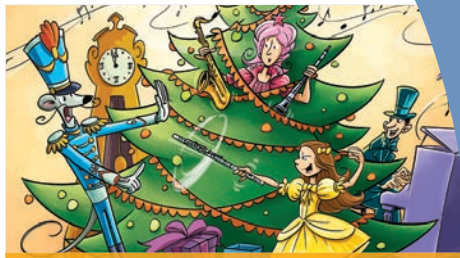
JAZZ-NOISETTE | 1 ER DÉC. 2019, 11 H