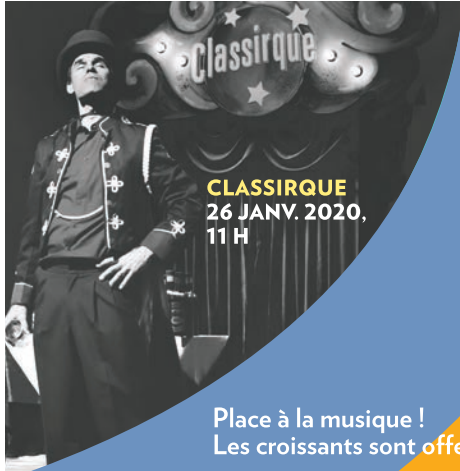
CLASSIRQUE 26 JANV. 2020, 11 H