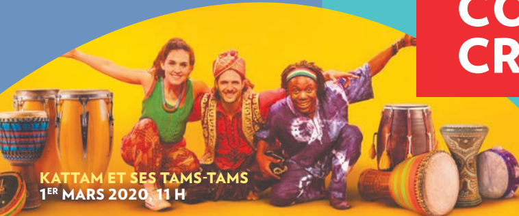
KATTAM ET SES TAMS-TAMS 1 ER MARS 2020, 11 H