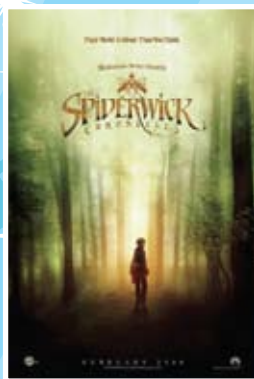
Les chroniques de Spiderwick Du 6 au 10 juillet