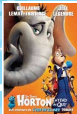
Horton entend un qui! Du 13 au 17 juillet