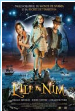
L'île de Nim Du 3 au 7 août