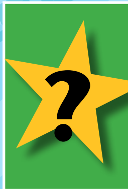
Film SURPRISE Du 10 au 14 août