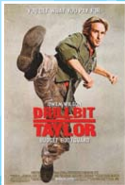
Drillbit Taylor: garde du corps Du 27 au 31 juillet