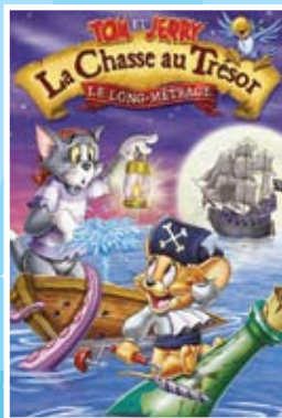
La Chasse au Trésor Du 29 juin au 3 juillet