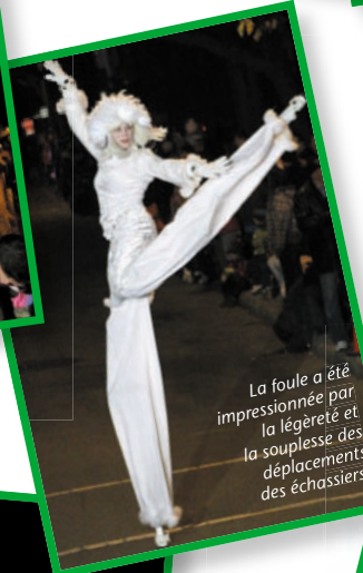
La foule a été impressionnée par la légèreté et la souplesse des déplacements des échassiers.