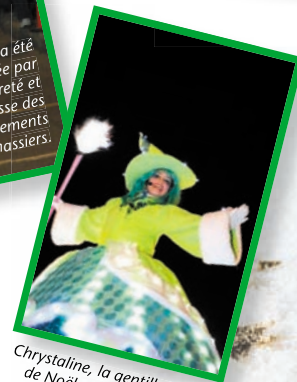
Chrystaline, la gentille sorcière de Noël, alliée du père Noël, sauvait les enfants du haut de ses 12 pieds tout au long du parcours.