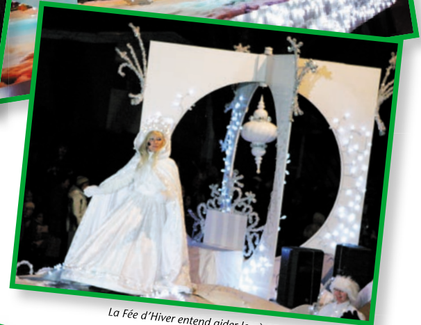
La Fée d'Hiver entend aider le père Noël à accomplir ses préparatifs pour combler chaque foyer.