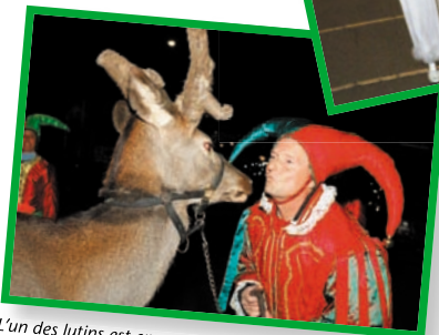
L'un des lutins est en compagnie du magnifique renne qui précède le char du père Noël.