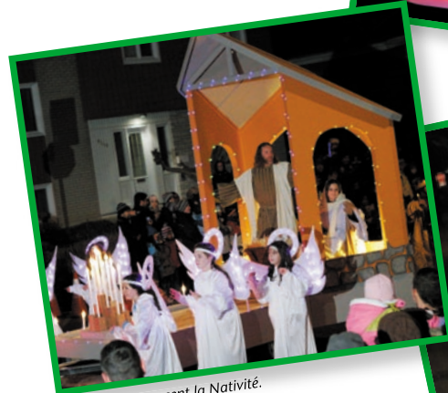
Les anges annoncent la Nativité.