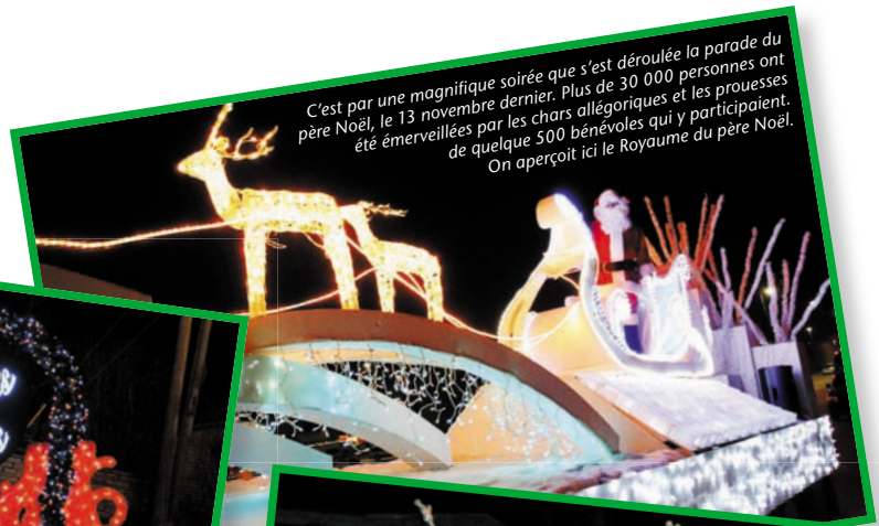
C'est par une magnifique soirée que s'est déroulée la parade du père Noël, le 13 novembre dernier. Plus de 30 000 personnes ont été émerveillées par les chars allégoriques et les prouesses de quelque 500 bénévoles qui y participaient. On aperçoit ici le Royaume du père Noël.