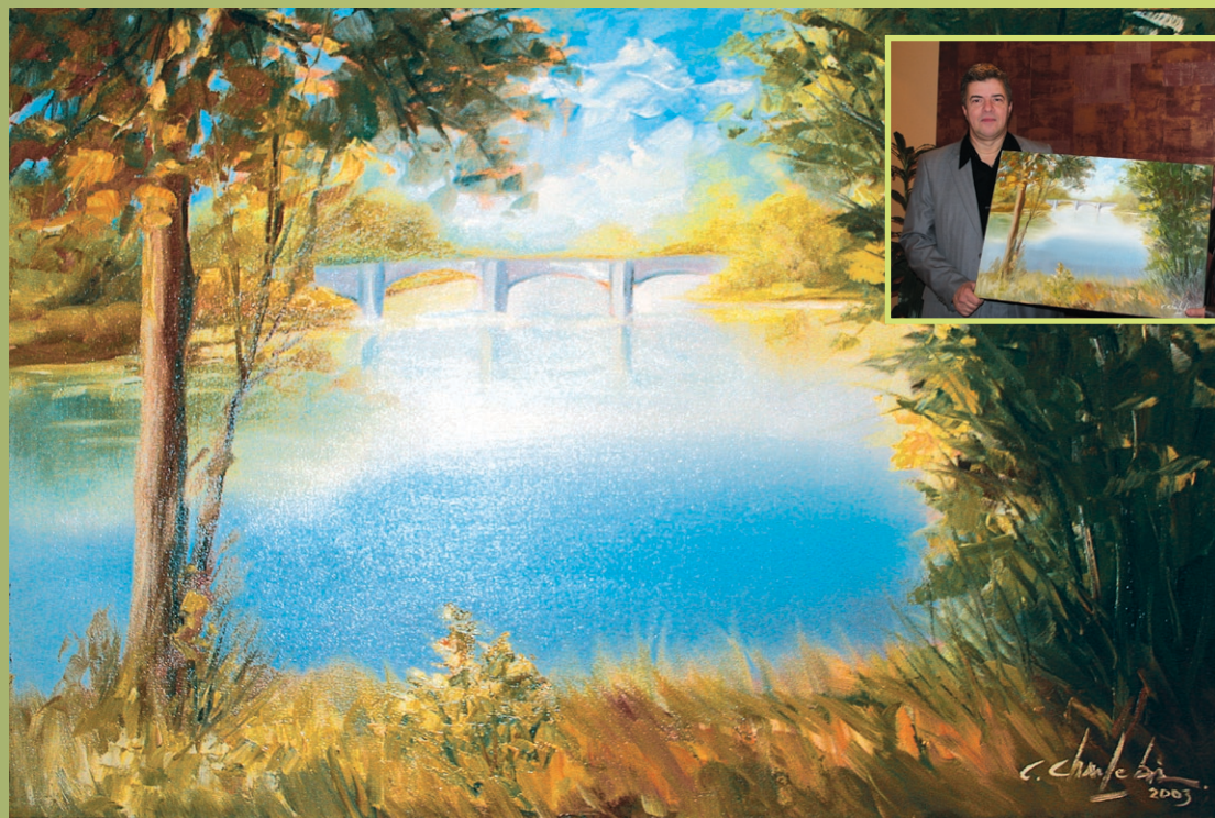
Claude Charlebois, Anjou-sur-le-lac, huile, 50,8 x 73,66 cm, 2003.